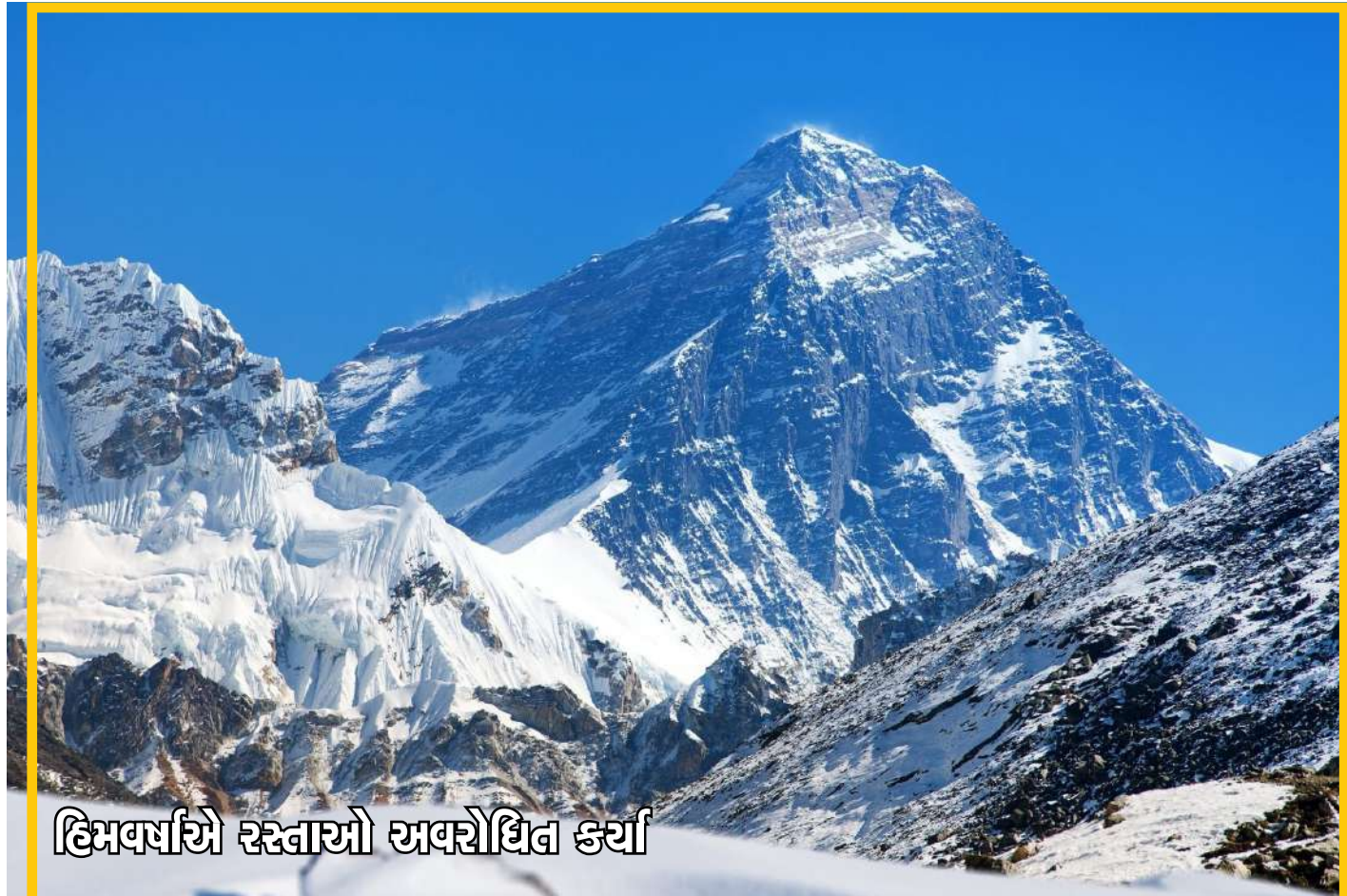
હિમવર્ષાએ રસ્તાઓ અવરોધિત કર્યા