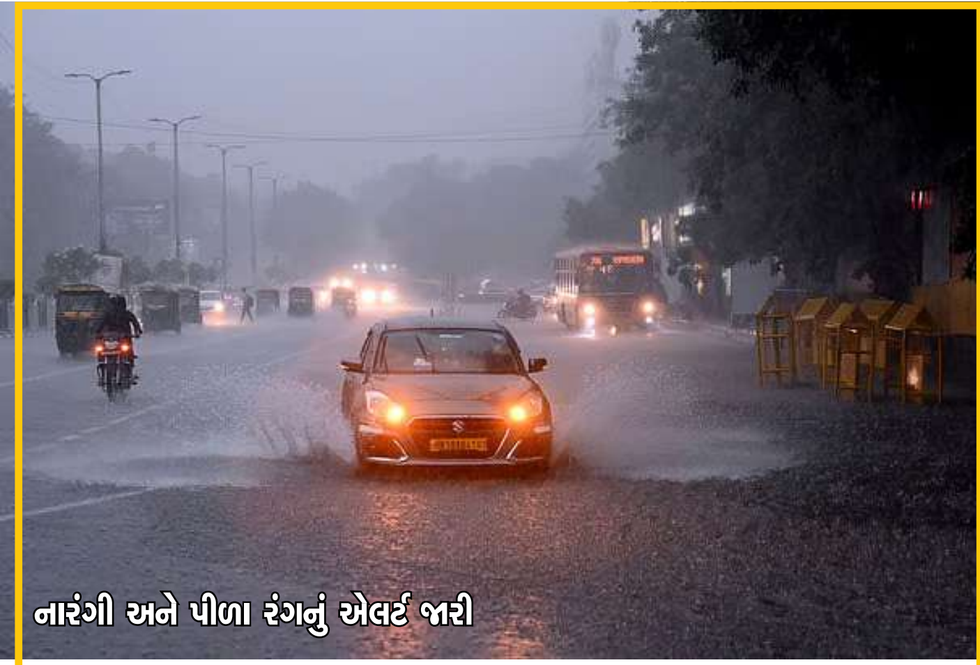
નારંગી અને પીળા રંગનું એલર્ટ જારી