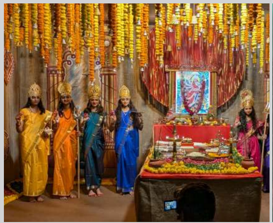
સોસાયટી ટીમમાં સભ્યએ જણાવ્યું કે — “દર વર્ષે અમે પ્રયત્ન કરીએ કે નવરાત્રી માત્ર મઠ માટે નહિ, પણ સંદેશ માટે પણ યાદ રહે. મશાલ રાસ દ્વારા અમે ભક્તિ, શિસ્ત અને સેવા — આ ત્રણેયનો સંયુક્ત સંદેશ આપવાનો પ્રયાસ કર્યો છે.”

જ્યારે સમગ્ર શહેર DJ, માનેકચોક અને કલબ ગ્રાઉન્ડ પર ગરબા રમે છે, ત્યારે અહીં ભક્તિ સાથે ઝળહળતું રાસ એક અલગ જ સંદેશ આપતો જોવા મળ્યો. ઓપરેશન સિદ્ધ ગરબા” દ્વારા રાષ્ટ્રભક્તિનો સંદેશ સફલ પરિસર-૧ સોસાયટીના રહેવાસીઓએ ભારતીય સેનાની શક્તિ અને સમર્પણને સલામ કરતાં ‘ઓપરેશન સિદ્ધ ગરબા’નું આયોજન કર્યું.