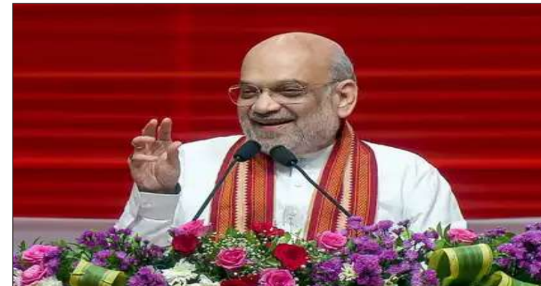
૪૫ કરોડ રૂપિયાના ખર્ચે દયાલપુર ગામમાં ૪૫ કરોડ રૂપિયાના ખર્ચે નર્સિંગ કોલેજોનું ઉદ્ધાટન કરવામાં આવશે, જ્યારે દિલ્હી-હિસાર રોડ પર તન્ન ફીડર અને બીએસબી કેર બ્લોક હોસ્પિટલ, સોનીપતના ખાનપા આવેલા બે-લેન પુલનું પણ ૧૨.૦૩ કરોડ રૂપિયાના ખર્ચે ઉદ્ધાટન કરવામાં આવશે. તેવી જ રીતે, પોલીસ લાઈન્સ જીંદમાં ૪૨ ટાઈપ-૨, ૩૬ ટાઈપ-૩ અને ૬ ટાઈપ-૨ ઘરો અને મહેન્દ્રગઢ જિલ્લાના નારનોલમાં ઉદ્ધ રેસ્ટ હાઉસ બ્લોકનું ઉદ્ધાટન કરવામાં આવશે. કરનાલાના અસંધ સબડિવિઝનમાં ૭૬.૧૯ કરોડના ખર્ચે ૧૦૦ બેઝની હોસ્પિટલ, સોનીપતમાં ૧૩૮.૧૨ કરોડના ખર્ચે મધર એન્ડ ચાઈલ્ડ બ્લોક સિવિલ હોસ્પિટલ અને ૩૩ કરોડના ખર્ચે નુહમાં મધર એન્ડ ચાઈલ્ડ બ્લોક હોસ્પિટલનો શિલાન્યાસ કરવામાં આવશે. તેવી જ રીતે, ગૃહમંત્રી ૨૦.૭૪ કરોડના ખર્ચે કરનાલામાં કિટિકલ કેર બ્લોક હોસ્પિટલ, સોનીપતના ખાનપા ૨૨.૫૩ કરોડના ખર્ચે કિટિકલ કેર બ્લોક હોસ્પિટલ અને ૨૨.૫૮ કરોડના ખર્ચે નુહમાં કિટિકલ કેર બ્લોક હોસ્પિટલનો શિલાન્યાસ પણ કરશે.

કુરુક્લેગ, તા.૨ | કેન્દ્રીય ગૃહમંત્રી અમિત શાહ આવતીકાલે, ૩ ઓક્ટોબરના રોજ આ ધાર્મિક નગરીથી રાજ્ય માટે ૮૨૫ કરોડ રૂપિયાના ૧૯ પ્રોજેક્ટ્સનું ઉદ્ધાટન કરશે. તેઓ ૨૬૨ કરોડ ૫૧ લાખ રૂપિયાના ૧૧ પ્રોજેક્ટ્સનો શિલાન્યાસ કરશે. એટલું જ નહીં, કુરુક્લેગના પેડી રામનગર ગામમાં ૪૪.૪૦ કરોડ રૂપિયાના ૫૨, કેથલામાં ૪૩.૯૭ કરોડ રૂપિયાના ૫૨, પંચકુલામાં ખેડાવલી ગામમાં ૩૫.૧૩ કરોડ રૂપિયાના ૫૨, ફરીદાબાદમાં ૪૫ કરોડ રૂપિયાના ૫૨ નર્સિંગ કોલેજોનું ઉદ્ધાટન કરવામાં આવશે, જ્યારે દિલ્હી-હિસાર રોડ પર તન્ન ફીડર અને બીએસબી કેર બ્લોક હોસ્પિટલ, સોનીપતના ખાનપા આવેલા બે-લેન પુલનું પણ ૧૨.૦૩ કરોડ રૂપિયાના ખર્ચે ઉદ્ધાટન કરવામાં આવશે. તેવી જ રીતે, પોલીસ લાઈન્સ જીંદમાં ૪૨ ટાઈપ-૨, ૩૬ ટાઈપ-૩ અને ૬ ટાઈપ-૨ ઘરો અને મહેન્દ્રગઢ જિલ્લાના નારનોલમાં ઉદ્ધ રેસ્ટ હાઉસ બ્લોકનું ઉદ્ધાટન કરવામાં આવશે. કરનાલાના અસંધ સબડિવિઝનમાં ૭૬.૧૯ કરોડના ખર્ચે ૧૦૦ બેઝની હોસ્પિટલ, સોનીપતમાં ૧૩૮.૧૨ કરોડના ખર્ચે મધર એન્ડ ચાઈલ્ડ બ્લોક સિવિલ હોસ્પિટલ અને ૩૩ કરોડના ખર્ચે નુહમાં મધર એન્ડ ચાઈલ્ડ બ્લોક હોસ્પિટલનો શિલાન્યાસ કરવામાં આવશે. તેવી જ રીતે, ગૃહમંત્રી ૨૦.૭૪ કરોડના ખર્ચે કરનાલામાં કિટિકલ કેર બ્લોક હોસ્પિટલ, સોનીપતના ખાનપા ૨૨.૫૩ કરોડના ખર્ચે કિટિકલ કેર બ્લોક હોસ્પિટલ અને ૨૨.૫૮ કરોડના ખર્ચે નુહમાં કિટિકલ કેર બ્લોક હોસ્પિટલનો શિલાન્યાસ પણ કરશે. રોહતક ખારખોડા-દિલ્હી સરહદી માર્ગના મજબૂતીકરણ માટે ૨૨.૦૪ કરોડના ખર્ચે, રોહતકના કન્હેલી રોડ પર ૧૩.૮૮ કરોડના ખર્ચે ડેરી સંકુલ, ૯૭.૭૩ કરોડના ખર્ચે ચરખી દાદરીમાં જિલ્લા જેલની ઈમારત અને ૮૬.૧૭ કરોડના ખર્ચે પંચકુલામાં જિલ્લા જેલની ઈમારતનો શિલાન્યાસ કરવામાં આવશે. જિલ્લા નાયબ કમિશનર વિશ્રામ કુમાર મીણા કહે છે.