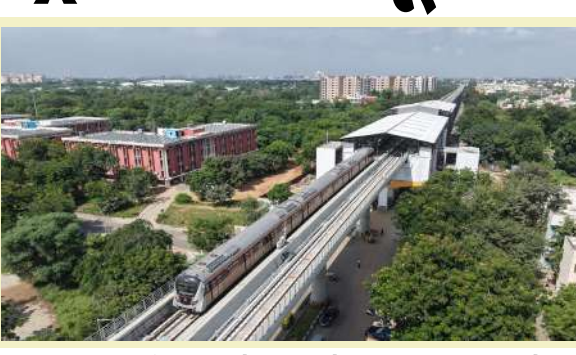
રેલની સગવડ મળતી થશે. આ કામગીરી પૂરી થવાથી અમદાવાદ અને ગાંધીનગરના કુલ ૬૮ કિલોમીટરના રૂટ પરના ૫૩ સ્ટેશનોને મેટ્રો રેલ સુવિધા મળશે અને મુસાફરી વધુ સસ્તી આરામદાયક અને પ્રદૂષણમુક્ત બનશે. નૂતન વર્ષના આરંભમાં ગાંધીનગરના નાગરિકોને

। પ્રતિનિધિ, ગાંધીનગર, તા.૨ । નૂતન વર્ષના આરંભમાં ગાંધીનગરના નાગરિકોને મહાત્મા મંદિર સુધી મેટ્રો રેલની સુવિધા ઉપલબ્ધ થશે. મુખ્યમંત્રી ભૂપેન્દ્ર પટેલના સતત માર્ગદર્શનમાં ગાંધીનગર મેટ્રો રેલની કામગીરી વધુ વેગવાન બની છે. વિજ્યા દશમીના પાવન પર્વે ગાંધીનગરમાં મેટ્રો રેલની ટ્રાયલ રન સચિવાલયથી આગળ વધીને અંતિમ સ્ટેશન મહાત્મા મંદિર સુધી સફળતાપૂર્વક શરૂ કરવામાં આવી છે. મુખ્યમંત્રી ભૂપેન્દ્ર પટેલના સતત માર્ગદર્શનમાં મેટ્રો રેલની કામગીરી વધુ વેગવંતી બની છે અને હાલ સચિવાલય સુધી દોડવવામાં આવતી મેટ્રો રેલને વધુ પાંચ સ્ટેશન અક્ષરધામ, જુના સચિવાલય, સેક્ટર-૧૬ અને સેક્ટર-૨૪ તથા અંતિમ સ્ટેશન મહાત્મા મંદિર સુધી ટ્રાયલ રન આ ટ્રાયલ રન પૂર્ણ થયા પછી કમિશનર મેટ્રો રેલ સેક્ટરી સમક્ષ જરૂરી મંજૂરીઓ માટે દરખાસ્ત કરવામાં આવશે અને નૂતન વર્ષના આરંભમાં મહાત્મા મંદિર સુધી મેટ્રો