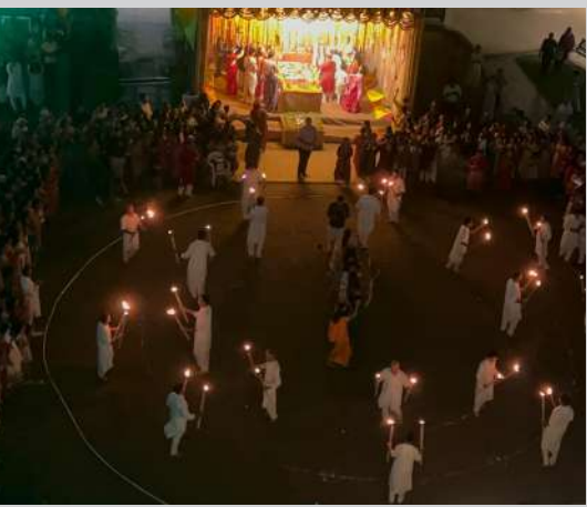
સોસાયટી ટીમમાં સભ્યએ જણાવ્યું કે — “દર વર્ષે અમે પ્રયત્ન કરીએ કે નવરાત્રી માત્ર મઠ માટે નહિ, પણ સંદેશ માટે પણ યાદ રહે. મશાલ રાસ દ્વારા અમે ભક્તિ, શિસ્ત અને સેવા — આ ત્રણેયનો સંયુક્ત સંદેશ આપવાનો પ્રયાસ કર્યો છે.”