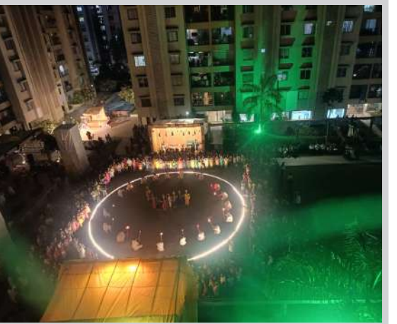
સોસાયટી ટીમમાં સભ્યએ જણાવ્યું કે — “દર વર્ષે અમે પ્રયત્ન કરીએ કે નવરાત્રી માત્ર મઠ માટે નહિ, પણ સંદેશ માટે પણ યાદ રહે. મશાલ રાસ દ્વારા અમે ભક્તિ, શિસ્ત અને સેવા — આ ત્રણેયનો સંયુક્ત સંદેશ આપવાનો પ્રયાસ કર્યો છે.”

ન્યૂઝ ટ્રિફ્ટ જામનગરમાં ચેક રિટર્ન અંગેના કેસમાં સજા પામેલા બે ફરારી આરોપીઓ પોલીસના હાથે ઝડપાયા