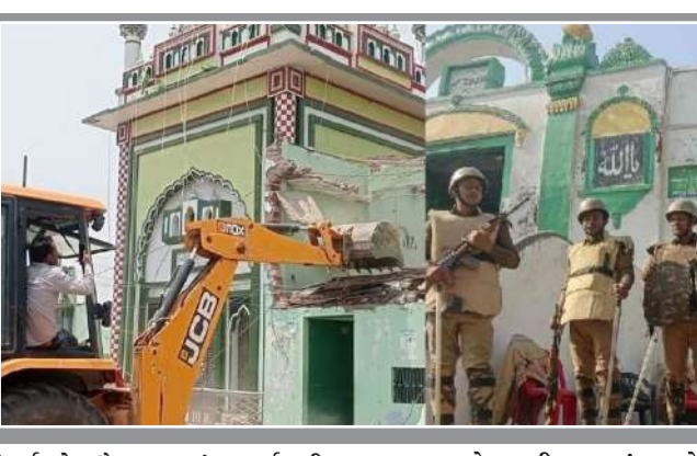
સંપૂર્ણપણે તેયાર હતું. કાર્યવાહી દરમિયાન અર્ધલશ્કરી દળો અને પોલીસની ઘણી કંપનીઓ ઘટનાસ્થળે હાજર હતી. એસડીએમએ જણાવ્યું હતું કે ૨૬ જૂન, ૨૦૨૫ ના રોજ નોટિસ જારી કરવામાં આવી હતી. યુપીઆરસી ની કલમ ૬૮ હેઠળ કેસ નોંધવામાં આવ્યો હતો. આ આદેશ ૨ સપ્ટેમ્બર, ૨૦૨૫ ના રોજ જારી કરવામાં આવ્યો હતો. બે સરકારી પ્લોટ ઇ: પ્લોટ નં. ૬૯૧, જે તળાવનો વિસ્તાર છે, કુલ ૧૧૬૦ ચોરસ મીટર. બીજો પ્લોટ પ્લોટ નં. ૪૬૯ છે, જે ૫૯૨ ચોરસ મીટરનું માપ ધરાવે છે. એક સ્થળ લગ્ન મંડપ છે અને બીજો મસ્જિદ છે. તે આદેશના આધારે કાર્યવાહી કરવામાં આવી હતી. કાયદેસર રીતે

સંભલ, તા.૨ | સંભલ જિલ્લામાં ગેરકાયદેસર બાંધકામો તોડી પાડવા માટે વહીવટીતંત્ર ફરી એકવાર તેના બુલડોઝરનો ઉપયોગ કરી રહ્યું છે, અને તે પણ રાવણ દહનના દિવસે. આ કાર્યવાહી માટે મોટી પોલીસ ફોર્સ તેનાત કરવામાં આવી છે. ગેરકાયદેસર રીતે કબજા હેઠળની તળાવની જમીન પર બનેલી મસ્જિદ અને લગ્ન ગૃહ તોડી પાડવા બાદ, વહીવટીતંત્ર ગુરુવારે ગેરકાયદેસર બાંધકામો તોડી પાડવામાં આવ્યું છે. સંભલના રયા બુઝુર્ગ ગામમાં આ મોટી કાર્યવાહી થઈ રહી છે. વહીવટીતંત્રના જણાવ્યા અનુસાર, સરકારી તળાવની જમીન પર ગેરકાયદેસર રીતે બાંધકામ કરવામાં આવ્યું હતું. ગુરુવારે સવારે ૧૧ વાગ્યે શરૂ થયેલી આ કાર્યવાહી ચાલુ કરવામાં આવી હતી. કાયદો અને વ્યવસ્થા જાળવવા માટે વહીવટીતંત્ર