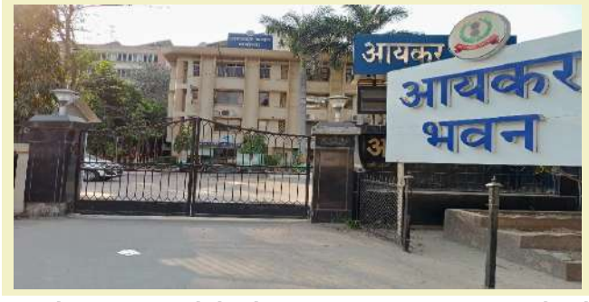
લઘુ અને મધ્યમ કદના ઉદ્યોગો માટેની જોગવાઈઓ, સહકારી સંસ્થાઓ વગેરે વિષય પર નિષ્ણાતો દ્વારા વિવિધ માહિતીસભર સત્રો યોજાશે. ઉપરાંત કોલેજના વિદ્યાર્થીઓ દ્વારા સાંસ્કૃતિક કાર્યક્રમ પણ રજૂ કરવામાં આવશે. ચર્ચા સત્ર દરમિયાન આવકવેરા અધિનિયમ ૨૦૨૫ને

। પ્રતિનિધિ, વડોદરા, તા.૨ । ભારતના આવકવેરા વિભાગ દ્વારા વડોદરામાં તા.૬ થી ૮ દરમિયાન ટેક્સપેયર્સ હબનું આયોજન કરવામાં આવ્યું છે. ત્રણ દિવસનો આ કાર્યક્રમ નાગરિકો, વ્યવસાયિકો અને વિદ્યાર્થીઓને માટે ઉપયોગી રહેશે. ટેક્સપેયર્સ હબનો મુખ્ય હેતુ આવકવેરા વિભાગના કરદાતા સાથેના મૈત્રીપૂર્ણ અભિગમ અંગે જાગૃતિ લાવવાનો અને આવનારી પેઢીને દેશના નિર્માણમાં ટેક્સની ભૂમિકા સમજાવવામાં મદદરૂપ થવાનો છે, તેમજ આવકવેરા વિભાગનું કહેવું છે. આ હબમાં આવનારા મુલાકાતીઓ નવો આવકવેરા કાયદો, આવકવેરા કાયદામાં સુધારા, ટીડીએસના નવા નિયમો, પ્રત્યક્ષ કરને લગતી બાબતો,