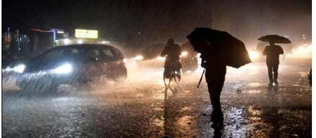
સવારથી સાંજ સુધીમાં સૌરાષ્ટ્ર અને કચ્છના વિવિધ વિસ્તારોમાં એકથી ત્રણ ઇંચ વરસાદ વરસ્યો હોવાનું નોંધાયું છે. આવી રીતે જ દક્ષિણ ગુજરાતના જુદા જુદા વિસ્તારોમાં અડધાથી પોણો ઇંચ વરસાદ વરસ્યો હતો. ગુજરાતના ૧૦૪ તાલુકાઓમાં હળવા-ભારે વરસાદ આજના દિવસમાં

પ્રતિનિધિ, અમદાવાદ, તા.૩ | ગુજરાતમાંથી વિદાય લઈ રહેલા મેઘરાજાએ જતાં જતા ધમાકેદાર ઈનિંગ શરૂ કરી છે. સૌરાષ્ટ્ર-કચ્છના ૧૭ તાલુકાઓમાં ગુરુવારે ૧ થી ૩ ઇંચ સુધી વરસાદ વરસી ગયો છે. આવી રીતે જ દક્ષિણ ગુજરાતના વિવિધ વિસ્તારોમાં પણ વરસાદની હાજરી નોંધાઈ છે. આજે શુક્રવારે પણ સૌરાષ્ટ્ર-કચ્છ અને દક્ષિણ ગુજરાતમાં ભારે વરસાદની આગાહી હવામાન વિભાગે કરી છે. વિદાય લઈ રહેલા ચોમાસાના અંતિમ દિવસોમાં ગુજરાતભરમાં વરસાદ વરસ્યો છે. નવરાત્રિમાં પણ બે દિવસ સુધી વરસાદ વરસતા ખેલેલાઓના રંગમાં ભંગ પડ્યો હતો. દરમિયાનમાં દેશના દિવસે