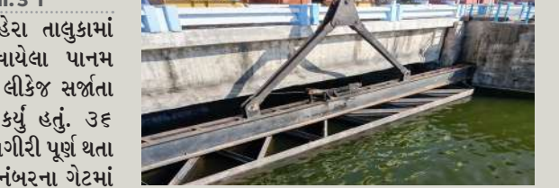
સિંચાઈ યોજના વિભાગ-૧ વડોદરાના અધિકારીઓ કામે લાગ્યા હતા. લીકેજ થયેલી જગ્યાએથી પાણીનો પ્રવાહ વધે નહીં તે માટે પ્રાથમિક તબક્કે વેસ્ટ કોન્ટેનર મુકાવી લીકેજ થતું પાણી ઓછું કર્યું હતું, ત્યારબાદ રિપેરિંગ કામગીરી હાથ ધરવામાં આવી હતી. બે નંબરના ગેટની આગળના સ્ટોપલોગ મૂકવાનું ચાલુ કર્યું હતું. આ કામગીરી આશરે ૩૬ કલાક ચાલી હતી. ગઈકાલે ડેમના ગેટમાં લીકેજ થવાને પગલે નદી કાંઠા વિસ્તારમાં આવેલ ગામોના રહીશો ભયભીત થઈ ગયા હતા. આ ડેમના ૧૦ ગેટ છે. તે તમામ બંધવવાના છે.

પ્રતિનિધિ, પંચમહાલ, તા.૩ | શહેરા પંચમહાલ જિલ્લામાં શહેરા તાલુકામાં આવેલા અને ૧૯૭૭-૭૮માં બંધાયેલા પાનમ ડેમના એક ગેટની આગળના ભાગે લીકેજ સર્જતા તાત્કાલિક તંત્રે રિપેરિંગ કામ શરૂ કર્યું હતું. ૩૬ કલાકની જહેમત બાદ મરામતની કામગીરી પૂર્ણ થતા તંત્રે રાહત અનુભવી હતી. ડેમના બે નંબરના ગેટમાં ડાબી બાજુ રમ્પ સીલમાં ગઈકાલે લીકેજ થયાનું સામે આવ્યું હતું. જેથી પાનમ યોજના વડુળ વિભાગ અને