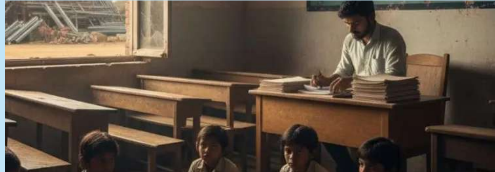
મહત્વનું છે કે ગુજરાતમાં જ્યાં સરકારી અને કોર્પોરેશન સ્કૂલોના પ્રાથમિક શિક્ષકો પાસે હજુ પણ અનેક પ્રકારની કામગીરીઓ કરાવવામા આવે છે, ત્યારે શિક્ષકો બાળકોના શિક્ષણમાં પુરું ધ્યાન આપી શકતા ન હોઈ તેની સીધી અસર દેખાય છે. દર વર્ષે ધોરણ ૧૦-૧૨ના બોર્ડ પરીક્ષામાં આદિજાતિ વિસ્તારના જિલ્લાઓનું પરિણામ ઓછું આવે છે. જ્યારે કરોડો રૂપિયા ખર્ચવા છતાં પણ પ્રાથમિક અને માધ્યમિક શિક્ષણમાં હજુ પણ આદિજાતિ વિસ્તારના જિલ્લામાં શિક્ષણનું સ્તર જોઈએ તેટલું સુધર્યું નથી.

પોલીસે ઘટનાસ્થળેથી રૂ. ૧.૦૨ કરોડની કિંમતની કુલ ૫૨,૮૪૦ બોટલ વિદેશી દારૂનો જથ્થો કબજે કર્યો