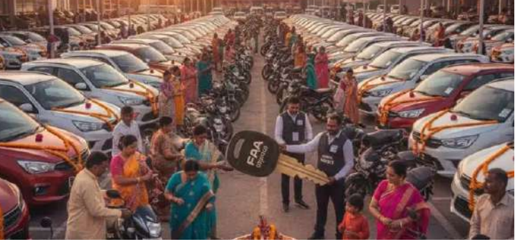
જુએસટી ૨.૦ના અમલ બાદ ઓટો ઈન્ડસ્ટ્રીમાં ભારે તેજ જોવા મળી છે. ટુ વ્હિલરની એવરેજ કિંમતમાં ૧૦ હજાર માંગતા ગ્રાહકોની મોટી ડિમાન્ડને પગલે સુધી અને કારની કિંમતમાં એક લાખ સુધીનો મોટો ઘટાડો થયો છે. જેની અસર ગાંધીઓ-ટુ વ્હિલરના બુકિંગમાં જોવા મળી છે. કારના બુકિંગમાં એસયુવી કારનું

પ્રતિનિધિ, અમદાવાદ, તા.૩ | દેશમાં ૨૨મી સપ્ટેમ્બરથી જુએસટીના નવા દર લાગુ પડતા સૌથી વધુ મોટો ફાયદો ઓટોમોબાઇલ ઈન્ડસ્ટ્રીને થયો હોઈ આ વર્ષે નવરાત્રીથી દશેરાના દિવસોમાં કાર-ટુ વ્હિલરના જંગી વેચાણ સાથે સારી એવી તેજ આ ઈન્ડસ્ટ્રીમાં જોવા મળી છે. ઓટોમોબાઇલ ડીલર્સ એસોસિયેશનના ફેડરેશન દ્વારા જાહેર કરાયેલા આંકડાઓ મુજબ દશેરા (બીજી ઓક્ટોબર)ના દિવસે ગુજરાતમાં ૪૪ હજાર ટુ વ્હિલર અને ૧૦ હજાર કારની ડિલિવરી થઈ છે. નવરાત્રીથી દશેરાના ૧૦ દિવસમાં જ ગુજરાતમાં ૧ લાખથી ૧.૧૦ લાખ જેટલા ટુ વ્હિલર બુક થયા હતા અને ડિલિવરી થયા છે. જ્યારે આ દસ દિવસમાં ૨૨ હજારથી ૨૪ હજાર કારનું બુકિંગ થયુ હતુ. ઓટોમોબાઇલ ડીલર્સ એસોસિયેશનના ફેડરેશને જાહેર કરેલી માહિતી મુજબ,