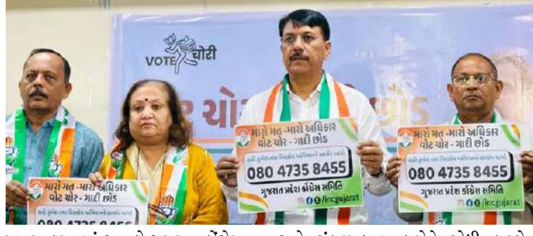
પ્રયાસ કરવામાં આવશે. ગુજરાત કોંગ્રેસના નેતાઓ અને કાર્યકર્તાઓ આ મુંબેશમાં સક્રિય રૂપે જોડાશે. તેઓ ઘર ઘર ફરીને એકે એક પરિવાર સુધી પહોંચી નક્કી, ખોટા

। પ્રતિનિધિ, અમદાવાદ, તા.૩ । ગુજરાતમાં ચૂંટણીમાં થતી ગેરરીતિઓ અને વોટચોરીના પડયંત્રને ઉજાગર કરવા માટે ગુજરાત કોંગ્રેસ મેદાને ઉતરી છે. કોંગ્રેસે આશ્ચર્ય કર્યો છે કે ગુજરાતમાં ચોરગદીના આરોપોને પગલે પ્રદેશ કોંગ્રેસે આગામી ૩ થી ૧૦ ઓક્ટોબર દરમિયાન રાજ્યભરમાં 'વોટ ચોર-ગદી છોડ' અભિયાન શરૂ કરવાની જાહેરાત કરી છે. પ્રદેશ કોંગ્રેસ પ્રમુખ અમિત યાવડાએ આકરા પ્રહાર કરતા જણાવ્યું હતું કે, ચૂંટણી પંચની આજે પ્રમાણિકતા અને નિષ્પક્ષતાને બદલે ભારતીય જનતા પાર્ટીની કટપુતળી બની ગયું છે અને દેશમાં સુવ્યવસ્થિત પડયંત્રના ભાગરૂપે વોટ ચોરી ચાલી રહી છે.