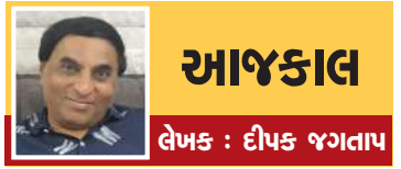
આજકાલ લેખક : દીપક જગતાપ