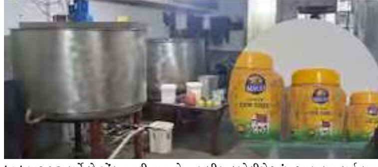
ધમધમ શરૂ કર્યો છે. ચોંકાવનારી વાત તો એ છે કે, અમરોલી પોલીસ સ્ટેશનની હદમાં આ નકલી ઘીનો કારોબાર ધમધમતો હતો છતાં તેને આ વાતની જાણ કેમ નહોતી? કે પછી ખુદ પોલીસે આંખ આડા કાન કર્યા હતા તે સવાલ ચર્ચાઈ રહ્યો છે. જો જીરૂ બાતમીના આધારે આવી મોટી કાર્યવાહી કરી શકતી હોય તો પછી સ્થાનિક પોલીસ કેમ ન કરી

। પ્રતિનિધિ, સુરત, તા.૪ । આગામી દિવાળીના તહેવાર પહેલા જ સુરતના અમરોલી-કોસાડ વિસ્તારમાંથી નકલી ઘી બનાવતા ત્રણ ફેક્ટરીઓ ઝડપાઈ છે. ફેક્ટરીમાં બ્રાન્ડેડ ઘીની આડમાં નકલી ઘી બનાવવા અને વેચવાની ટીમે ચોક્કસ બાતમીના આધારે આ સફળ ઓપરેશન પાર પાડ્યું હતું. જેમાં ૩. ૧. ૨૦ કરોડનો મુદ્દામાલ જમ કરી ૪ આરોપીઓની ધરપકડ કરી છે. દરોડા દરમિયાન પોલીસે રૂપિયા ૬૦,૦૦,૫૫૦ની કિંમતનું ૯,૯૧૯ કિલોગ્રામ નકલી ઘી કબ્જું કર્યું છે. આ સાથે ઘી બનાવવા માટેના મશીનરી અને મટિરિયલ પણ કબજે કર્યું છે, જેની અંદાજિત કિંમત રૂ. ૫૩,૫૫,૯૫૦ જેટલી થાય છે. આમ કુલ મળીને પોલીસે રૂ. ૧,૨૦,૫૬,૫૦૦નો મુદ્દામાલ જમ કર્યો છે. પોલીસે કરેલી પ્રાથમિક પૂછપૂછમાં જાણવા મળ્યું કે, આરોપીઓ આર્થિક ફાયદા માટે આ ભેળસેળયુક્ત ડુપ્લીકેટ ઘી સ્વમ વિસ્તારની કિરાણીની દુકાનો પર અને આજુબાજુના જિલ્લાઓમાં બજારભાવ કરતાં સસ્તા દરે છૂટક વેચાણ કરતા હતા. આરોપીઓ ભેળસેળયુક્ત નકલી ઘી કેટલા સમયથી બનાવતા હતા અને અત્યાર સુધી કોને-કોને વેચવામાં આવતું હતું, કોણ તેના બંધારણ હતા તે દિશામાં પોલીસે તપાસનો