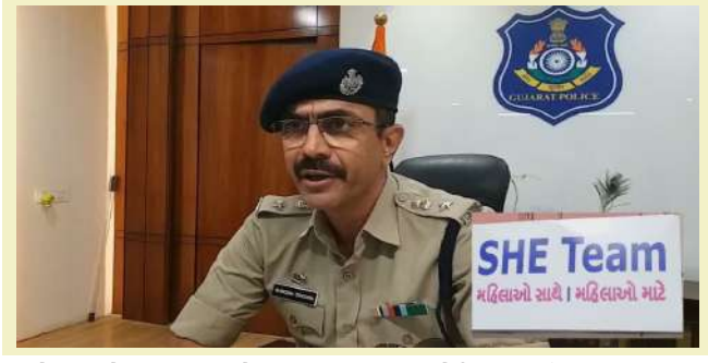
કરીને ગરબે રમવા માટે આવતા ખેલેયાઓ અને ખાસ કરીને મહિલા આયોજિત ગરબા પંડાલોમાં હાજર રહીને અસામાજિક તત્વોને પકડી પાડવા માટેનું અભિયાન શરૂ કર્યું હતું. જેમાં નવ દિવસો દરમિયાન કુલ ૧૦૦૫ જેટલા ઇશમોને પોલીસે પકડી પાડીને તમામ વિરુદ્ધ ધોરણસરની

। પ્રતિનિધિ, જુનાગઢ, તા.૪ । નવરાત્રીના નવ દિવસો દરમિયાન જુનાગઢ પોલીસે અલગ અલગ ગુનામાં ૧૦૦૦ કરતાં વધારે ઇસમોને પકડી પાડીને કાયદેસરની કાર્યવાહી કરી છે. નવરાત્રિના સમયમાં ખાસ કામે લગાડવામાં આવેલી શી ટીમ દ્વારા ડ્રિફ્ટ એન્ડ ડ્રાઈવ, હથિયાર રાખવા, ટ્રાફિક અડચણ સહિત બીજા કેટલાક ગુનાઓમાં કુલ ૧૦૦૫ જેટલા વ્યક્તિઓ વાહનચાલકો અને અપરાધીઓ વિરુદ્ધ ગુનો નોંધીને કાર્યવાહી કરી હતી. નવરાત્રીના દિવસોમાં ગુનેગારો અને આચારતત્વો અને અસામાજિક પ્રવૃત્તિઓ સાથે જોડાયેલા ઇશમોને પકડી પાડવા માટે દર વર્ષની જેમ આ વર્ષે પણ નવરાત્રીના દિવસો દરમિયાન ખાસ શી ટીમની રચના