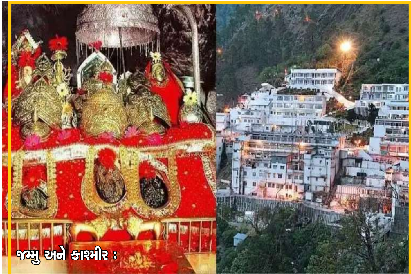
જમ્મુ અને કાશ્મીર :