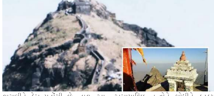
લાગણીને ટેલ પહોંચી છે. હાલ, આ સમગ્ર મામલે પોલીસમાં ફરિયાદ દાખલ કરવા માટે તજવીજ હાથ ધરવામાં આવી છે. આ સિવાય મૂર્તિ ખંડિત કરનાર સામે અસામાજિક તત્ત્વોને શોધીને કડકમાં કડક કાર્યવાહી કરવામાં આવે તે અંગે માંગ કરવામાં આવી રહી છે. નોંધનીય છે કે, હજુ સુધી આ કૃત્ય કોણે અને શા માટે કર્યું તે વિશે કોઈ જાણકારી સામે આવી નથી. ગિરનારના ગોરખનાથ મંદિરથી મોટા સમાચાર સામે આવ્યા છે. મોટી રાત્રે ૫૫૦૦ પગથિયા ઉપર આવેલા મંદિરમાંથી અજાણ્યા શખસો દ્વારા ગોરખનાથના મંદિરમાંથી મૂર્તિની તોડફોડ કરી જંગલ વિસ્તારમાં ફેંકી દેવામાં આવી હતી. સમગ્ર ઘટનાથી ભાવિ ભક્તોમાં રોષ ભભુક્યો છે અને પ્રતિમાની તોડફોડ કરનાર સામે કડક સજાની માંગ કરવામાં આવી રહી છે. સમગ્ર બાબતે શેરનાથ બાપુએ જણાવ્યું કે, ગિરનાર પર ૫૫૦૦ પગથિયા ઉંચે ગિરનાર ગોરખનાથનું મંદિર આવેલું છે.

વહેલી સવારે ૩ થી ૪ વાગ્યાની આસપાસ આ ઘટના બની હતી. જેમાં મૂર્તિ તોડનાર અસામાજિક તત્ત્વોએ સૌથી પહેલાં પૂજારીના રૂમનો દરવાજો બહારથી બંધ કરી દીધો હતો. પરંતુ જ્યારે ઘોંઘાટ થયો તો અંદર સુતેલા પૂજારીઓએ બારીમાંથી જોયું તો ઝપ માણસો તેમણે બાગના જોયા. વધુમાં તેમણે જણાવ્યું કે, આ અજાણ્યા શખસોએ ગોરખનાથજીની મૂર્તિને ખંડિત કરીને જંગલમાં નીચે ફેંકી દીધી હતી. હાલ, ખંડિત મૂર્તિ મળી ગઈ બાપુએ જણાવ્યું કે, ગિરનાર પર ૫૫૦૦ પગથિયા ઉંચે ગિરનાર ગોરખનાથનું મંદિર આવેલું છે. રવિવારે (૫ ઓક્ટોબર)