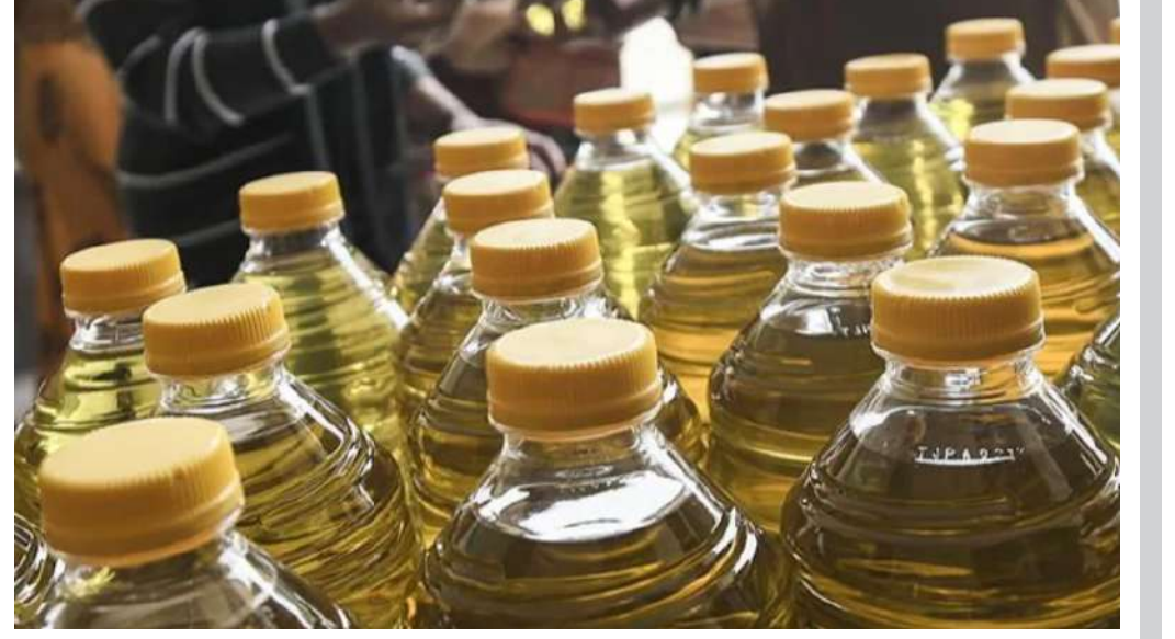
આગામી દિવાળીના તહેવારો અંતર્ગત લોકોના આરોગ્યની સુગ્રાહકી માટે સેફ્ટી વાનની કામગીરી વધુ સઘન બનાવવામાં આવશે તેમ સુચનોએ જણાવ્યું હતું. જિલ્લા દુધ વિભાગ દ્વારા ગત માસમાં ભાવનગરમાંથી મીઠાઈના ૮, ફરસાણના ૫, અન્ય ૧ અને બોટાદમાંથી દુધનો ૧, ધીનો ૧, ખાધ તેલનો ૧, મીઠાઈના ૪ અને ફરસાણનો ૧ મળી કુલ ૨૩ નમૂના રેગ્યુલર મેળવી લેબોરેટરી ટેસ્ટિંગ માટે મોકલ્યા હોવાનું જણાયું છે.