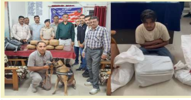
વડોદરા રેલવે સ્ટેશન પર તેનાત ડોગ સ્કવોડની મદદથી ટ્રેનોમાં તપાસ શરૂ કરવામાં આવી. તપાસ દરમિયાન અમદાવાદ-પુરી એક્સપ્રેસના જી૧ કોચ તથા જનરલ કોચના ક્રોડોરમાં બિનવારસી સ્થિતિમાં રાખેલ થેલી મળી આવી. ડોગ સ્કવોડ સંદિગ્ધ પ્રતિક્રિયા આપતા પોલીસે થેલી ખોલી તપાસ કરતા અંદાજે ૧૫ કિલોગ્રામ ગાંજો મળી આવ્યો.