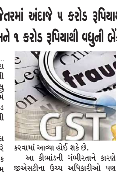
કરવામાં આવ્યા હોઈ શકે છે. આ કોલેજની ગંભીરતાને કારણે જીએસટીના ઉચ્ચ અધિકારીઓ પણ ચોંકી ઉઠ્યા છે.

જામનગર શહેરમાં જીએસટીની તપાસ દ્વારા જામનગરમાં શરૂ કરાયેલી દરોડાની કાર્યવાહી સતત છઠ્ઠા દિવસે પણ ચાલુ રહી હતી. અમદાવાદની જીએસટી ટીમે અત્યાર સુધીમાં અંદાજે ૫૦૦ કરોડ રૂપિયાથી વધુના શંકાસ્પદ વ્યવહારોની તપાસ કરી છે. તપાસ અધિકારીઓએ આશંકા વ્યક્ત કરી છે કે, આ વ્યવહારોના આધારે આશરે ૧૦૦ કરોડ રૂપિયાથી વધુના ફેક ઈનપુટ ટેક્સ કેડિટ (આઈટીસી) ક્લેમ