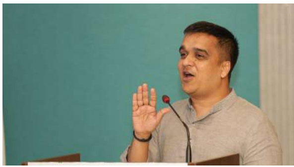
સાયબર ક્રાઈમનો ભોગ બની રહ્યાં છે. ખાસ કરીને વડીલો ડિજિટલ એરેસ્ટના શિકાર બની રહ્યાં છે. આ સ્થિતિમાં સાયબર ક્રાઈમ અંગેની જાગૃતિ અત્યંત જરૂરી છે. આ પ્રસંગે

ગુજરાત પોલીસને જરૂર ટકા સફળતા મળી છે. ગુજરાત પોલીસના કોન્સ્ટેબલને પણ ડાર્કવેબ, બ્લોકચેઈન, બીગ ડેટા, એઆઈ જેવા વિવિધ વિષયોની આંતરરાષ્ટ્રીય કક્ષાની સાયબર સુરક્ષાલક્ષી તાલીમ આપવામાં આવશે. જેનાથી આગામી વર્ષોમાં પડકારજનક ગુનાઓને અટકાવવામાં સફળતા પ્રાપ્ત થઈ શકે. આ તબક્કે ગૃહ રાજ્ય મંત્રી હર્ષ સંઘવીએ કહ્યું હતું કે, સાયબર ક્રાઈમથી બચવાનો એકમાત્ર ઉપાય એટલે જાગૃતિ.