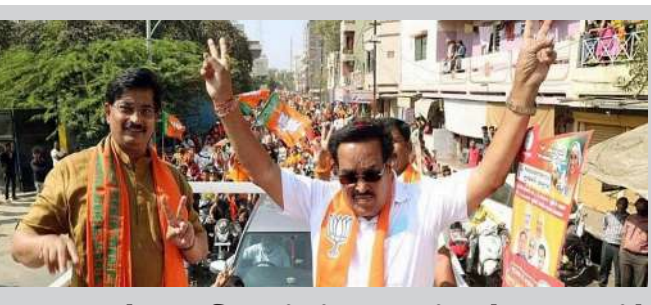
અગાઉ, જ્યારે જળશક્તિ મંત્રી સી.આર. પાટીલ પ્રદેશ પ્રમુખ તરીકે ચૂંટાયા હતા, ત્યારે તેમનું વડોદરામાં સ્વાગત કરવામાં આવ્યું હતું

વડોદરા પહોંચશે, જેમાં શહેર સંગઠન ટીમ પણ સામેલ થશે, જે કાર્યકર માટે રોડમેપ તૈયાર કરશે, જેમાં રોડ કાર્યકરોનો સમાવેશ થશે. રૂટને કેસરી રંગથી શણગારવામાં આવશે, જેમાં ૧૦,૦૦૦ કાર્યકરોને જોડવાનો લક્ષ્યાંક છે. જગદીશ વિશ્વકર્મા આવતા મંગળવારે વડોદરા પહોંચશે. શહેર ભાજપે આ માટે તૈયારીઓ શરૂ કરી દીધી છે. વિશ્વસનીય સૂત્રોના જણાવ્યા અનુસાર, જો જગદીશ રોડ માર્ગે આવશે, તો તેમના માટે સમા સાવલી રોડથી કારેલીબાગ અંબાલાલ પાર્ક સુધી રોડ શોનું આયોજન કરવામાં આવ્યું છે. જો તેઓ વિમાન માર્ગે આવશે, તો તેમનું એરપોર્ટ ગેટ પર સ્વાગત કરવામાં આવશે અને રોડ શોનું આયોજન કરવામાં આવશે. ભાજપ સંગઠન દ્વારા આયોજિત રૂટને કેસરી રંગથી શણગારવામાં આવશે. વધુમાં, એવું જણવા મળ્યું છે કે રોડ શો અને કાર્યકર્તા સંમેલનમાં ૧૦,૦૦૦ થી વધુ કાર્યકરોને સામેલ કરવાનું લક્ષ્ય છે. એવું પણ જણવા મળ્યું છે કે નવનિયુક્ત પ્રદેશ પ્રમુખનું સ્વાગત કરવા માટે વિવિધ સ્થળોએ કાર્યકરો હાજર રહેશે. નોંધનીય છે કે નજીકના ભવિષ્યમાં નગરપાલિકાની ચૂંટણીઓ યોજવાની છે. તે પહેલાં, નવા પ્રદેશ પ્રમુખની ચૂંટણી પછી, કાર્યકરો સભાઓ યોજશે અને તેમને ફરીથી ઉર્જાવાન બનાવવાનો પ્રયાસ કરશે જેથી તેઓ નગરપાલિકાની ચૂંટણીમાં સારું પ્રદર્શન કરી શકે.