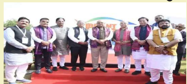
રિજિયોનલ કોન્ફરન્સનો પ્રારંભ આજે મહેસાણાના ગણપત યુનિવર્સિટીમાં મુખ્યમંત્રી ભુપેન્દ્રભાઈ પટેલના હસ્તે થયો. રાજ્યમાં પ્રથમવાર આયોજિત

વડનગર, અંબાજી, પાટણની રાણીની વાવ, મોઢેરા સૂર્યમંદિર અને નડાબેટ જેવા ઐતિહાસિક તથા ધાર્મિક સ્થળોની મુલાકાત પણ યોજાશે. ગુજરાત પરંપરાગત રીતે કૃષિ, ફૂડ પ્રોસેસિંગ, ડેમિકલ-પેટ્રોકેમિકલ, ટેક્સટાઈલ, જેમ્સ-જ્વેલરી અને એન્જિનિયરિંગ ક્ષેત્રમાં અગ્રેસર રહ્યું છે. હવે રાજ્ય સરકારનું ધ્યેય ઉદ્યમાન ક્ષેત્રો — જેમ કે સેમિકન્ડક્ટર, ઈલેક્ટ્રિક મોબિલિટી, એરોસ્પેસ, રિકેન્સ અને ગ્રીન એનર્જીમાં ગુજરાતને રાષ્ટ્રીય લીડર બનાવવાનું છે. ગુજરાતમાં ઉદ્યોગ વિકાસ અને રોકાણના નવા દ્વાર ખોલવા માટે વાઈબ્રન્ટ ગુજરાત