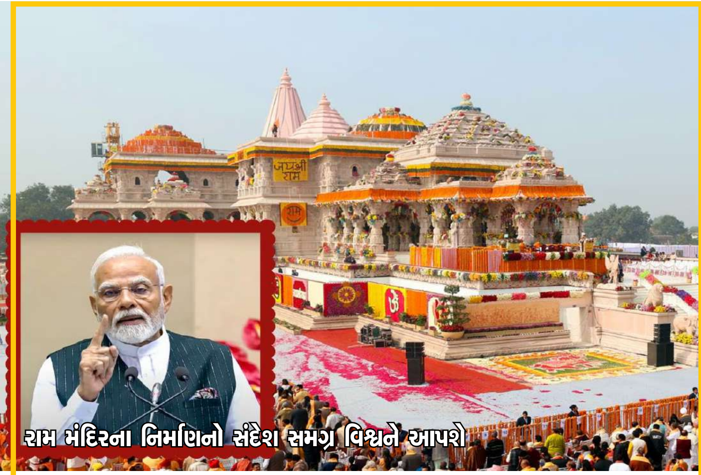
રામ મંદિરના નિર્માણનો સંદેશ સમગ્ર વિશ્વને આપશે