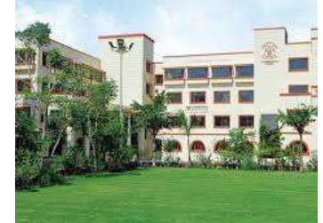
1 પ્રતિનિધિ, અમદાવાદ, તા.૯ | રાજ્યમાં ખાનગી શાળાઓની ફી નિયમન કરતી ફી રેગ્યુલેટરી કમિટીએ અમદાવાદની ચાર શાળાઓને પાંચ લાખનો દંડ ફટકાર્યો છે. આ ચારેય શાળાઓ એફઆરસીએ નક્કી કરેલી ફી કરતા વધુ ફી વાલીઓ પાસે વસૂલી રહી હતી. આ ચાર શાળાઓમાં અમદાવાદની જેમ્સ જિનેશિસ,

શિવ આશિષ, તુલીપ ઈન્ટરનેશનલ અને વેદાંત ઈન્ટરનેશનલ સ્કૂલનો સમાવેશ થાય છે. અગાઉ આ શાળાઓને નોટિસ ફટકારી મુલાસો કરવા જણાવાયું હતું. ત્યારબાદ આ કાર્યવાહી કરવામાં આવી છે. ખાનગી શાળાઓ વાલીઓ પાસેથી વધુ ફી વાલીઓ પાસે વસૂલી રહી હતી. આ ચાર શાળાઓ એફઆરસીએ નિયત ધોરણ જળવાઈ રહે તે માટે ફી રેગ્યુલેટરી