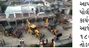
એક હજારથી વધુ પોલીસ અને અન્ય અધિકારીઓનો કાફલો તૈનાત હતો બહિયલ ગામમાં તંત્રએ કડક કાર્યવાહી કરતા પ્રથમ તબક્કામાં મેગા ડિમોલિશન હાથ ધર્યું છે. ૧૮૬ જેટલા એકમો પર દાદાનું બુલડોઝર ફેરવવાની કામગીરી હાથ ધરવામાં આવી રહી છે. બહિયલ ગામના બજારના આંધકામોમાં બુલડોઝર ફેરવીને કડક સંદેશો

1 પ્રતિનિધિ, ગાંધીનગર, તા.૯ | નવરાત્રીના બીજા નોરતાની રાતે બહિયલ ગામમાં બે જૂથો વચ્ચે મારામારી, વાહનો તથા દુકાનોમાં તોડફોડ - આગચંપી અને પથરમારાની ઘટના ઘટી હતી. આ સાથે ટોળાએ પોલીસ પર પણ હુમલો કર્યો હતો. જે બાદ ગાંધીનગર પોલીસે કડક કાર્યવાહી હાથ ધરી છે. આજે વહેલી સવારથી જ બહિયલ ગામમાં મેગા ડિમોલિશન હાથ ધર્યું છે. ૧૮૬ જેટલા એકમો પર દાદાનું બુલડોઝર ફેરવવાની કામગીરી હાથ ધરવામાં આવી રહી છે. બહિયલ ગામના બજારના આંધકામો પર બુલડોઝર ફેરવવામાં આવી રહ્યું છે. ગાંધીનગરના એસપી, રવિ તેજ વાસમ શેટ્ટી સહિત ત્યાં