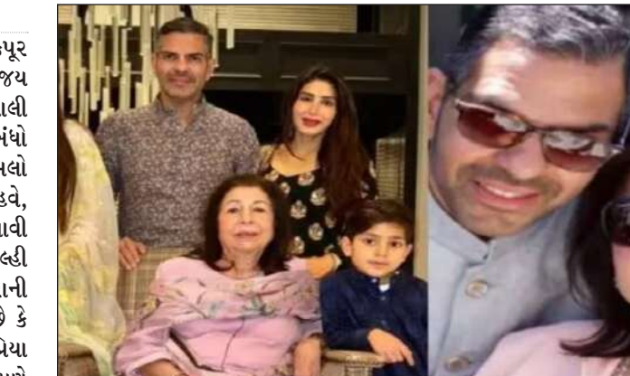
પ્રખ્યાત ઉદ્યોગપતિ અને કરિશ્મા કપૂરના પૂર્વ પતિ, સંજય કપૂરના મૃત્યુ પછી પણ, તેમની ૩૦,૦૦૦ કરોડની સંપત્તિનો વિવાદ ચાલુ છે. હવે, સંજય કપૂરની માતા,

મુંબઈ, તા.૯ | બોલિવૂડ અભિનેત્રી કરિશ્મા કપૂર હાલમાં સમાચારમાં છે. તેના પૂર્વ પતિ સંજય કપૂરના મૃત્યુ પછીથી મિલકત વિવાદ ચાલી રહ્યો છે. કરિશ્મા અને સંજય કપૂરના સંબંધો ઉતાર-ચઢાવથી ભરેલા રહ્યા છે. આ મામલો સંજય કપૂરના રૂ. ૩૦,૦૦૦ કરોડ. હવે, આ મામલે એક નવી અપડેટ સામે આવી છે. સંજય કપૂરની માતા, રાની કપૂરે દિલ્હી હાઈકોર્ટમાં સોગંદનામું દાખલ કર્યું છે. રાની કપૂરે પોતાના સોગંદનામમાં જણાવ્યું છે કે સંજય કપૂર અને તેમની ત્રીજી પત્ની, પ્રિયા સચદેવ વચ્ચેના સંબંધો સારા નહોતા. તેમણે વસિયતનામાની પ્રામાણિકતા પર પણ પ્રશ્ન ઉઠાવ્યો હતો.