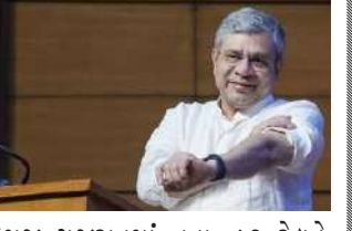
તેમજ ગુજરાતમાં નવા ૮૭ રેલવે સ્ટેશને નવનિર્માણ કરવામાં આવી રહ્યાં છે. તથા ૩૩૨ રેલવે બ્રિજ તૈયાર થઈ રહ્યા છે. બુલેટ ટ્રેનની કામગીરી ગુજરાતમાં ખૂબ ઝડપી થઈ રહી છે. ઓગસ્ટ ૨૦૨૭ દેશમાં પ્રથમ બુલેટ ટ્રેન ચાલે તેવો ટાર્ગેટ છે. ગુજરાતમાં ફેડ કોરિડોર કામ પૂર્ણ થયું છે. તથા આવાન દિવસોમાં ૩૧ રેલવે પ્રોજેક્ટની તૈયારી ચાલી રહી છે. સેમિન્ડર માટે ગુજરાત હબ બની રહ્યું છે. તેમાં ગુજરાતમાં ૪ પ્લાન્ટ છે. સાણંદ, ધોલેરામાં પ્લાન્ટ શરૂ થયા છે. તથા જાપાનની ૩૦ કંપની ગુજરાતમાં રોકાણ કરવા જઈ રહી છે. ઈલેક્ટ્રિક મેન્યુફેક્ચરિંગમાં ખૂબ માંગ જોવા મળી રહી છે. જેમાં ઈલેક્ટ્રિક મેન્યુફેક્ચરિંગમાં સ્કીમ લોન્ચ કરવામાં આવી છે. ઈલેક્ટ્રિક ઈકોસિસ્ટમ ગુજરાતમાં લાવવા અપીલ કરે છે. આ ઈન્ડસ્ટ્રી ગુજરાત આવે તે જરૂરી છે. ૧૩ યુનિવર્સિટી સેમી કન્ડક્ટર ટ્રેનિંગ આપવામાં આવી રહી છે. તથા જે પણ ગુજરાત મોટું હબ બનાવવા જઈ રહ્યું છે.

1 પ્રતિનિધિ, અમદાવાદ, તા.૯ | કેન્દ્રીય રેલવેમંત્રી અશ્વિની વૈષ્ણવ અમદાવાદથી મહેસાણા સુધીની રેલવે મુસાફરી કરી વાઈબ્રન્ટ ગુજરાત રીજનલ કોન્ફરન્સમાં પહોંચ્યા હતા. આ અંગેની મહેસાણાના સંસદસભ્ય હરિભાઈ પટેલે સોશિયલ મીડિયામાં પોસ્ટ પણ મૂકી છે. આ બે દિવસીય કોન્ફરન્સમાં ઉદ્યોગ તેમજ શિક્ષણ ક્ષેત્રના ૧૭ દેશના અગ્રણીઓ એકસાથે મંચ પર આવશે અને ગુજરાત સરકારની મધ્યસ્થી સાથે કરોડો રૂપિયાના એમઆયુ કરવામાં આવશે. આ કોન્ફરન્સમાં વિવિધ સેમિનાર તેમજ પેનલ ચર્ચાઓના માધ્યમથી ઉદ્યોગપતિઓ અને તજજ્ઞો વિચારો રજૂ કરશે. વાઈબ્રન્ટ ગુજરાત રીજનલ કોન્ફરન્સ અશ્વિની વૈષ્ણવે સંબોધન કરતા જણાવ્યું છે કે વાઈબ્રન્ટ સમિટની શરૂઆત ગુજરાતથી થઈ હતી. આજ દેશના અનેક રાજ્યમાં શરૂ થઈ છે. ગુજરાતનો વિકાસ સમગ્ર વિશ્વએ જોયો છે. રેલવે દેશની લાઈફ લાઈન છે. ગ્રીન લોજિસ્ટિક્સ કરવાનું સૌથી મોટું માધ્યમ છે. છેલ્લા ૧૧ વર્ષમાં ગુજરાતમાં ૨૭૬૪ કિમી રેલવે ટ્રેક બનાવ્યા છે. તથા ૩૫૦ કરોડ રૂપિયા એમઆયુ કરવામાં આવી રહી છે. તથા જે પણ ગુજરાત મોટું હબ બનાવવા જઈ રહ્યું છે.