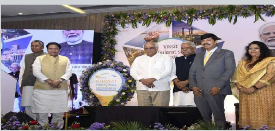
ખાખાન, દક્ષિણ કોરિયા, વિયેતનામ અને નધરલેન્ડ્સ સહિતના દેશોના પ્રતિનિધિઓ કોન્ફરન્સમાં ઉપસ્થિત રહ્યા

1 પ્રતિનિધિ, મહેસાણા, તા.૯ | ગુજરાતમાં ઉદ્યોગ વિકાસ અને રોકાણના નવા દ્વાર ખોલવા માટે વાઈબ્રન્ટ ગુજરાત રિજિયોનલ કોન્ફરન્સનો પ્રારંભ આજે મહેસાણાના ગણપત યુનિવર્સિટીમાં મુખ્યમંત્રી ભુપેન્દ્રભાઈ પટેલના હસ્તે થયો. રાજ્યમાં પ્રથમવાર આયોજિત આ પ્રાદેશિક કોન્ફરન્સમાં ઓટો, ફાર્મા, ડેરી અને ગ્રીન એનર્જી જેવા ચાર મુખ્ય ક્ષેત્રોમાં રોકાણ આકર્ષવા પર ખાસ ધ્યાન કેન્દ્રિત કરવામાં આવ્યું છે. દર બે વર્ષે યોજાતી વાઈબ્રન્ટ ગુજરાત ગ્લોબલ સમિટ રાજ્યના ઉદ્યોગ વિકાસ માટે એક આંતરરાષ્ટ્રીય બ્રાન્ડ બની ચૂકી છે. પરંતુ આ વખતે પ્રથમવાર રિજિયોનલ સ્તરે કોન્ફરન્સ શરૂ કરવામાં આવી છે, જેથી સ્થાનિક ઉદ્યોગપતિઓ, યુવા ઉદ્યોગ સાહસિકો અને સ્ટાર્ટઅપ્સને પણ વૈશ્વિક રોકાણકારો સાથે સીધો સંપર્ક અને નેટવર્કિંગનો અવસર મળે. બે દિવસીય આ કોન્ફરન્સમાં ઉદ્યોગપતિઓ, સરકારી સંસ્થાઓ, વિદેશી વેપારગૃહો, શૈક્ષણિક તથા સંશોધન સંસ્થાઓ સહીત વિવિધ ક્ષેત્રોના પ્રતિનિધિઓ એક મંચ પર આવશે. વિદેશના ૨૧૬ પ્રતિનિધિઓ અને ૩૫ આંતરરાષ્ટ્રીય કંપનીઓએ ભાગ નોંધાવ્યો છે.