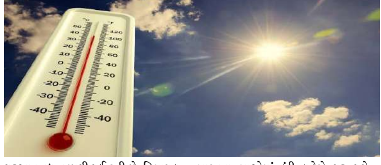
શરૂઆત વધુ ઝડપથી થઈ રહી છે. હિમાચલ પ્રદેશ, ઉત્તરાખંડ અને જમ્મુ-કાશ્મીરના ઉર્બાણવાણા વિસ્તારોમાં હિમવર્ષા થવાથી ઠંડીમાં વધારો થશે. હિમવર્ષા પછી ઉત્તર ભારતના ભાગોમાં ઠંડી લહેરો શરૂ થશે, જેની અસર આગામી દિવસોમાં ગુજરાત સહિત પશ્ચિમ ભારત સુધી પણ પહોંચી શકે છે. હવામાન વિભાગના ડિરેક્ટર જનરલ

। પ્રતિનિધિ, અમદાવાદ, તા.૧૦ । ગુજરાતમાં છેલ્લા કેટલાક અઠવાડિયાથી ચોમાસાની ઝાપટા વરસી રહ્યાં હતાં. પરંતુ હવે હવામાનમાં મોટો ફેરફાર જોવા મળી રહ્યો છે. હવામાન વિભાગ મુજબ, ચોમાસાએ સત્તાવાર રીતે વિદાય લીધી છે અને હવે રાજ્યમાં ભેવડી ઋતુ — એટલે કે ચોમાસા પછીની ઠંડીની શરૂઆત — અનુભવાઈ રહી છે. ખાસ કરીને વહેલી સવારે અને સાંજના સમયે લોકો ઠંડી પવનનો અહેસાસ કરી રહ્યા છે. રાજ્યના વિવિધ શહેરોમાં તાપમાનમાં ઘટાડો નોંધાઈ રહ્યો છે. હવામાન વિભાગના આંકડા મુજબ રાજ્યના સરેરાશ તાપમાનમાં ૨ ડિગ્રી જેટલો ઘટાડો થયો હતો. અમદાવાદમાં લઘુત્તમ તાપમાન બે ડિગ્રી ઘટીને ૨૨ ડિગ્રી સેલ્સિયસ થયું છે, જ્યારે નવિયામાં તો લઘુત્તમ તાપમાન ૨૦ ડિગ્રીની નીચે ઉતરીને ૧૯.૮ ડિગ્રી સુધી પહોંચી ગયું છે. આ આંકડા સ્પષ્ટ કરે છે કે હવે ગુજરાતમાં ઠંડીનું આગમન થઈ રહી છે. હાલના દિવસોમાં તો હળવી ઠંડીનો અહેસાસ છે, પરંતુ આવતા સપ્તાહમાં ઠંડી વધુ વધવાની સંભાવના છે. હવામાન નિષ્ણાતાનું કહેવું છે કે આ ફેરફાર સામાન્ય છે, કારણ કે ચોમાસા પછી તાપમાન ધીમે ધીમે ઘટે છે અને ઉત્તર ભારત તરફથી ઠંડી હવાનો પ્રવાહો દક્ષિણ તરફ સરકે છે. બીજી તરફ, ઉત્તર ભારતના રાજ્યોમાં ઠંડીની