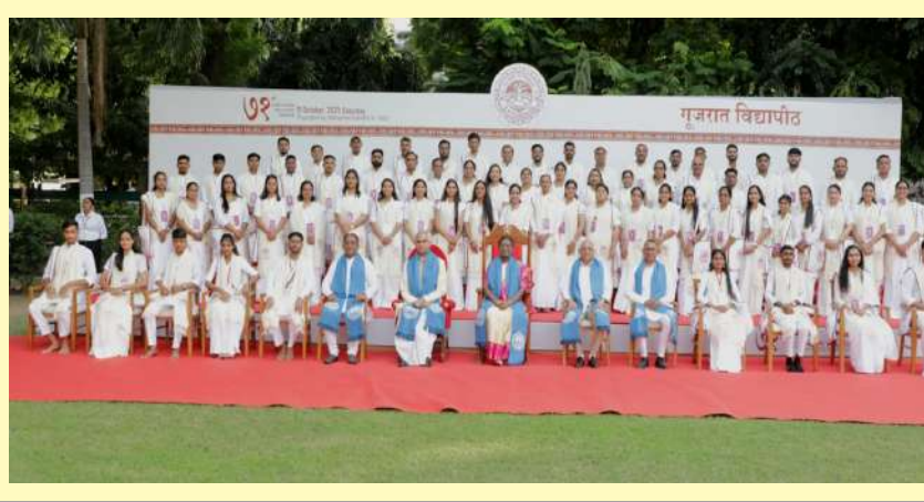
પ્રકાશ પાડતા મુખ્યમંત્રીશ્રીએ જણાવ્યું કે, મોદી સાહેબે સુરાજ એટલે કે ગુડ ગવર્નન્સનો મંત્ર આપ્યો છે. તેમણે જાતે હાથમાં ઝાડુ લઈને સ્વચ્છતાને એક જન આંદોલન બનાવ્યું છે. 'ખાદી ફોર નેશન, ખાદી ફોર ફેશન'ના આહ્વાન દ્વારા સ્વદેશીને પ્રોત્સાહન આપ્યું છે, જેના પરિણામે છેલ્લા ૧૧ વર્ષમાં ખાદીના વેચાણમાં ૪૪૭ ટકાનો અભૂતપૂર્વ વધારો થયો છે. તેમણે ઉમેર્યું કે, વિદ્યાપીઠ એક સદીથી વધુ સમયથી ગાંધીજીના સત્ય, અહિંસા અને શ્રમના મૂલ્યોને જીવંત રાખવામાં સફળ રહી છે. આ જ મૂલ્યોને આગળ વધારતા વડાપ્રધાનશ્રી પણ યુવાનોમાં 'રાષ્ટ્ર પ્રથમ'ની ભાવનાનું સિંચન કરી રહ્યા છે. નરેન્દ્રભાઈએ ગરીબ, યુવા, અગ્રદાતા કિસાન અને નારી શક્તિને વિકસિત ભારતના ચાર મુખ્ય સ્તંભ ગણાવ્યા છે, જેમાં યુવા શક્તિને વિશેષ મહત્વ આપ્યું છે. છેલ્લા એક દશકમાં સ્ત્રી, શિક્ષણ અને સ્ટાર્ટઅપ જેવા

ગુજરાત વિદ્યાપીઠના ૭૧મા દીક્ષાંત સમારોહમાં પદવીધારક વિદ્યાર્થીઓને સંબોધિત કરતા મુખ્યમંત્રી ભૂપેન્દ્ર પટેલે જણાવ્યું કે, વડાપ્રધાન શ્રી નરેન્દ્રભાઈ મોદીના નેતૃત્વમાં દેશ જ્યારે અમૃતકાળમાં આઝાદીની શતાબ્દી તરફ ગતિ કરી રહ્યો છે, ત્યારે રાષ્ટ્રપિતા મહાત્મા ગાંધી દ્વારા સ્થાપિત આ સંસ્થામાંથી દીક્ષાંતનો અવસર ગૌરવમય છે. તેમણે ઉમેર્યું કે, પરમ સન્માનનીય રાષ્ટ્રપિતા શ્રીમતી દ્રોપદી મુર્મુજીના હસ્તે પદવી પ્રાપ્ત કરવાનું સૌભાગ્ય મળવું એ વિદ્યાર્થીઓ માટે એક ઐતિહાસિક ક્ષણ છે. મુખ્યમંત્રીએ ગુજરાત વિદ્યાપીઠના વારસાને યાદ કરતાં કહ્યું કે, મહાત્મા ગાંધીજીએ ૧૯૨૦માં યુવાશક્તિને સત્ય, અહિંસા અને આત્મનિર્ભર ભારતના શાશ્વત વિચારો સાથે રાષ્ટ્ર નિર્માણ માટે પ્રેરિત કરવા આ વિદ્યાપીઠની સ્થાપના કરી હતી. આઝાદી માટે બ્રિટિશ સરકાર સામેની અસહકારની ચળવળનો પાયો રહેલી આ વિદ્યાપીઠનો આજનો પદવીદાન સમારોહ, વિકસિત અને આત્મનિર્ભર સ્વદેશી ભારતના સંવાહક યુવાઓના સમાજમાં પદાપ્તનો અવસર બન્યો છે. દીક્ષાંત સમારોહની પ્રાચીન ભારતીય પરંપરાનો ઉલ્લેખ કરતાં મુખ્યમંત્રીએ કહ્યું કે, પ્રાચીન કાળમાં ગુરુકુળમાં શિક્ષણ પૂર્ણ થયા બાદ ઋષિપુત્રોને સમાજ અને રાષ્ટ્ર માટે શિક્ષણનો ઉપયોગ કરવાનો ઉપદેશ અપાતો હતો. ભગવાન શ્રી રામ, શ્રી કૃષ્ણ અને પાંડવો પણ ગુરુકુળમાં શિક્ષિત-દીક્ષિત થયા હતા. તેમણે જણાવ્યું કે, આજે જે ગુરુકુળ પરંપરાનું સ્થાન આધુનિક વિશ્વવિદ્યાલયોએ લીધું છે અને ગુજરાત વિદ્યાપીઠ મૂલ્યનિષ્ઠ તેમજ સમયાનુકૂળ શિક્ષણ આપતી આગવી સંસ્થા તરીકે ઊભી આવી છે. વડાપ્રધાન નરેન્દ્રભાઈ મોદીના 'વિકસિત ભારત'ના વિઝન પર