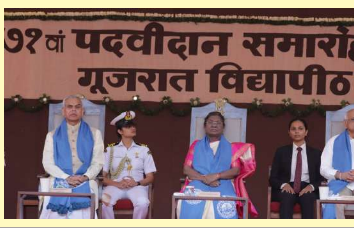
ઈન્ફિયરિયેટિવ દ્વારા યુવાનોને સશક્ત બનાવવામાં આવ્યા છે અને નવી શિક્ષણ નીતિ દ્વારા યુવાઓના ઈનોવેશનને વૈશ્વિક સ્તરે સ્પર્ધાત્મક બનાવવા માટે પ્રોત્સાહન આપવામાં આવી રહ્યું છે. પદવીધારક વિદ્યાર્થીઓને પ્રેરણા આપતા મુખ્યમંત્રીએ કહ્યું કે, 'વિદ્યાપીઠના વિદ્યાર્થીઓ અન્ય કરતાં ખાસ છે કારણ કે તેમણે શિક્ષણની સાથે સ્વ-અનુશાસન, શ્રમનું ગૌરવ અને સ્વદેશી જેવા મૂલ્યો આત્મસાત કર્યાં છે.' તેમણે બદલાતા વૈશ્વિક પરિદ્રવ્યમાં આત્મનિર્ભરતા અને સ્વદેશીની વધતી મહત્તા પર ભાર મૂક્યો અને વડાપ્રધાનશ્રી દ્વારા શરૂ કરાયેલા 'હર ઘર સ્વદેશી-ધર ઘર સ્વદેશી' અભિયાનના સંવાહક બની સમાજમાં જાગૃતતા લાવવા આહ્વાન કર્યું. મુખ્યમંત્રીએ સ્પષ્ટપણે જણાવ્યું કે, નરેન્દ્રભાઈ મોદીના મતે દરેક વસ્તુનો વિકલ્પ હોઈ શકે છે, પરંતુ સ્ત્રી, ઈનોવેશન અને

વિચારોને ચરિતાર્થ કરશે તેવો આશાવાદ તેમણે વ્યક્ત કર્યો હતો. આ અવસરે ગુજરાત વિદ્યાપીઠના પ્રધ્યાપકો, શિક્ષણવિદ એવા મહાનુભાવો અને વિદ્યાર્થીઓ મોટી સંખ્યામાં ઉપસ્થિત રહ્યા હતા. તેમણે કહ્યું, 'સ્વદેશીના રાષ્ટ્રવ્યાપી અભિયાનમાં તમારે સક્રિય ભૂમિકા ભજવવાની છે. 'રાષ્ટ્ર સર્વોપરી'ની ભાવના સાથે સ્થાનિક ઉત્પાદનોને પ્રોત્સાહન આપવાનું છે.' ગુજરાત વિદ્યાપીઠના ૭૧મા દીક્ષાંત સમારોહમાં પદવીધારક વિદ્યાર્થીઓને સંબોધિત કરતા મુખ્યમંત્રી શ્રી ભૂપેન્દ્ર પટેલે જણાવ્યું કે, વડાપ્રધાન નરેન્દ્રભાઈ મોદીના નેતૃત્વમાં દેશ જ્યારે અમૃતકાળમાં આઝાદીની શતાબ્દી તરફ ગતિ કરી રહ્યો છે, ત્યારે રાષ્ટ્રપિતા મહાત્મા ગાંધી દ્વારા સ્થાપિત આ સંસ્થામાંથી દીક્ષાંતનો અવસર ગૌરવમય છે. તેમણે ઉમેર્યું કે, પરમ સન્માનનીય રાષ્ટ્રપિતા દ્રોપદી મુર્મુજીના હસ્તે પદવી પ્રાપ્ત કરવાનું સૌભાગ્ય મળવું એ વિદ્યાર્થીઓ માટે એક ઐતિહાસિક ક્ષણ છે. મુખ્યમંત્રીશ્રીએ ગુજરાત વિદ્યાપીઠના વારસાને યાદ કરતાં કહ્યું કે, મહાત્મા ગાંધીજીએ ૧૯૨૦માં યુવાશક્તિને સત્ય, અહિંસા અને આત્મનિર્ભર ભારતના શાશ્વત વિચારો સાથે રાષ્ટ્ર નિર્માણ માટે પ્રેરિત કરવા આ વિદ્યાપીઠની સ્થાપના કરી હતી. આઝાદી માટે બ્રિટિશ સરકાર સામેની અસહકારની ચળવળનો પાયો રહેલી આ વિદ્યાપીઠનો આજનો પદવીદાન સમારોહ, વિકસિત અને આત્મનિર્ભર સ્વદેશી ભારતના સંવાહક યુવાઓના સમાજમાં પદાપ્તનો અવસર બન્યો છે. દીક્ષાંત સમારોહની પ્રાચીન ભારતીય પરંપરાનો ઉલ્લેખ કરતાં મુખ્યમંત્રીશ્રીએ કહ્યું કે, પ્રાચીન કાળમાં ગુરુકુળમાં શિક્ષણ પૂર્ણ થયા બાદ ઋષિપુત્રોને સમાજ અને રાષ્ટ્ર માટે શિક્ષણનો ઉપયોગ કરવાનો ઉપદેશ અપાતો હતો. ભગવાન શ્રી રામ, શ્રી કૃષ્ણ અને પાંડવો પણ ગુરુકુળમાં શિક્ષિત-દીક્ષિત થયા હતા.