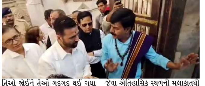
તેઓ જોઈને તેઓ ગદગદ થઈ ગયા હતા. આ તે, વડનગરવાસીઓએ અક્ષયકુમારનું તિલક કરીને ઉમળકાભેર સ્વાગત કર્યું હતું. અક્ષયે જણાવ્યું કે, તેઓ એવોર્ડ નાઈટ માટે ગુજરાત આવ્યા હતા, પરંતુ વડનગર જેવા ઐતિહાસિક સ્થળની મુલાકાતથી તેઓ ખૂબ ખુશ છે. આ મુલાકાત વડનગરના સાંસ્કૃતિક મહત્વને ઉજાગર કરશે અને લોકોને આ પ્રાચીન નગરની મુલાકાત લેવા પ્રેરશે. આ ઉપરાંત, આ મુલાકાત ગુજરાતના પ્રવાસન અને સાંસ્કૃતિક વારસા પર સકારાત્મક અસર કરશે તેવું માનવામાં આવે છે.

પ્રતિનિધિ, મહેસાણા, તા.૧૧ | અમદાવાદમાં યોજાનારા ફિલ્મફેર એવોર્ડ્સમાં હાજરી આપવા ગુજરાત આવેલા બોલિવૂડ સુપરસ્ટાર અક્ષયકુમારે આજે વડાપ્રધાન નરેન્દ્ર મોદીના વતન વડનગરની મુલાકાત લીધી હતી. આ મુલાકાત દરમિયાન તેઓ વડનગરના આધ્યાત્મિક અને ઐતિહાસિક વારસાથી ખૂબ પ્રભાવિત થયા અને તેમણે પોતાના અનુભવો ભાવુક શબ્દોમાં વ્યક્ત કર્યાં હતા. આ દરમિયાન મીડિયા સાથે વાત કરતા તેમણે કહ્યું કે, "હાટકેચર મંદિરમાં જ્યારે શાંત વાતાવરણ હોય છે ત્યારે તમે ધ્યાનથી સાંભળો તો તમને ધીમે ધીમે અવાજમાં 'ઓમ નમ: શિવાય' સંભળાય છે. આ અનુભવ અત્યંત શાંતિદાયક છે." તેમણે વધુમાં કહ્યું કે, "પ્રથમવાર વડનગર આવ્યો છું અને અહીંનો સમૃદ્ધ ઇતિહાસ જાણીને હું ખૂબ આનંદિત છું." અક્ષયકુમારે મંદિર દર્શન બાદ વડાપ્રધાન નરેન્દ્ર મોદીએ જે શાળામાં અભ્યાસ કર્યો હતો તે પ્રેરણા સ્ફૂર્ણની મુલાકાત લીધી હતી. આ શાળામાંથી તેમને મોદીના બાળપણ અને શિક્ષણ વિશે જાણવાનું મળ્યું હતું. ત્યારબાદ, તેમણે વડનગરના આર્કિયોલોજિકલ મ્યુઝિયમની મુલાકાત લીધી, જ્યાં ઐતિહાસિક અવશેષો અને કલાકૃ