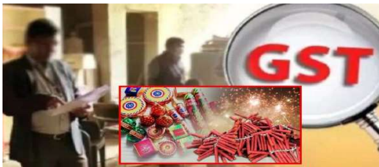
સાથે હાલ જીએસટી અધિકારીઓ દુકાનોના દસ્તાવેજો, બરીદી-વેચાણ રેકોર્ડ અને સ્ટોકની વિગતવાર ચકાસણી કરી રહ્યા છે. ડિપાર્ટમેન્ટ દ્વારા ગુજરાતના અમદાવાદ, વડોદરા, સુરત, રાજકોટ, પાલનપુર, હિંમતનગર સહિત નાના શહેરો મળીને ૬૦ પ્રિમાઈસીસ પર તપાસ ચાલી રહી છે. જેમાં અમદાવાદી ૧૧ પ્રિમાઈસીસનો

વેપારીઓના કૌભાંડ શોધી કાઢવા અભિયાન શરૂ કર્યું છે. અધિકારીઓએ ફટાકડાના વેપારીઓના કાચા-પાકા હિસાબ, બિલિંગની એન્ટ્રીઓ કાચી ચિઠ્ઠીઓ અને એમઆરપી કરતાં વધુ ભાવ વસૂલવાનો નથી તેની તપાસ હાથ ધરી છે. ખાસ કરીને અમદાવાદના વટવા અને વટવા ગામ વિસ્તારમાં એસજીએસટીએ અમદાવાદના ૧૧ વેપારી સહિત રાજ્યભરમાં ફટાકડાના ૬૦ વેપારીને ત્યાં મોટું સર્ચ ઓપરેશન શરૂ કર્યું છે. તાજેતરમાં જામનગરમાં ૨૧ પેટી પર દરોડા પાડી વિભાગે આશરે ૧૦૦ કરોડથી વધુની કરચોરી પકડી પાડી હતી. ત્યારબાદ ડિપાર્ટમેન્ટે ફટાકડાના હોલસેલના