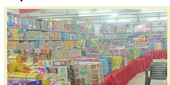
૯ ઓક્ટોબર, ૨૦૨૫ ના રોજ ૧૨ શહેરો/તાલુકાઓ — અમદાવાદ, સુરત, આણંદ, વડોદરા, અરવલ્લી, સાબરકાંઠા, રાજકોટ, ગાંધીધામ, વાપી, જામનગર, વલસાડ અને મોરબી માં આવેલી ૩૭ કરદાતાઓના ૬૯ ધંધાના સ્થળોએ તપાસની કામગીરી હાથ ધરવામાં આવેલ. તપાસ દરમિયાન

। પ્રતિનિધિ, અમદાવાદ, તા. ૧૧ । કેટલાક કેસોમાં બિલ વિના ફટાકડાના વેચાણો તથા જીએસટીકમ્પલાયન્સમાં કરવામાં આવતી ગેરરીતિઓ વિશે મળેલ આધારભુત માહિતીના આધારે, ગુજરાત રાજ્ય ગુડ્સ એન્ડ સર્વિસ ટેક્સ (એસજીએસટી) વિભાગે ફટાકડાના ઉત્પાદન અને વેપાર સાથે સંકળાયેલા ૩૭ કરદાતાઓ વિરુદ્ધ રાજ્યવ્યાપી તપાસની કાર્યવાહી હાથ ધરવામાં આવેલ. વિભાગને મળેલી માહિતી મુજબ કેટલાક ફટાકડા વેપારીઓ બિલ વગર (કાચી ચિઠ્ઠીઓ દ્વારા) ફટાકડાનું વેચાણ કરી રહ્યા હતા. આ માહિતીના આધારે, અધિકારીઓએ ગ્રાહક તરીકે વિવિધ સ્થળોની મુલાકાત લીધી અને મેળવેલી માહિતીના વિશ્લેષણ પછી