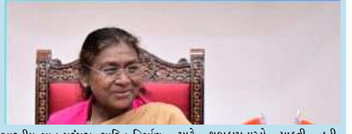
ભારતીય જ્ઞાન પરંપરા, ચારિત્ર નિર્માણ માટે શુભકામનાઓ પાઠવી હતી. ગાંધીજીના વિચારોને ટાંકીને રાષ્ટ્રપિતાએ કહ્યું કે, આશાનું કિરણ બહાર નહીં, પરંતુ આપણા હૃદયની અંદર શોધવાનું છે.

ગાંધીજીના વિચારોને ટાંકીને રાષ્ટ્રપિતાએ કહ્યું કે, આશાનું કિરણ બહાર નહીં, પરંતુ આપણા હૃદયની અંદર શોધવાનું છે. તેમણે વિદ્યાપીઠના સૂત્ર 'સા વિદ્યા યા મુકતે' નો અર્થ સમજાવતા કહ્યું કે, જે વિદ્યા મુક્તિ અપાવે તે જ સાચી વિદ્યા છે. માત્ર આજીવિકા માટે વિદ્યા ગ્રહણ કરવી ઉચિત નથી, કારણ કે વિદ્યા તો આજીવન ચાલનારી પ્રક્રિયા છે. તેમણે વિદ્યાર્થીઓને સમાજ અને રાષ્ટ્રની પ્રગતિને ધ્યાનમાં રાખીને જીવન જીવવા અને સમાજ સેવા દ્વારા દેશનું ઋણ ચૂકવવા માટે પ્રેરણા આપી. તેમણે 'સર્વોદય'ના સિદ્ધાંતને અનુસરીને સમાજના વંચિત વર્ગોના હિતમાં કામ કરવા અને પર્યાવરણ અનુકૂળ વિકાસ માટે પ્રયાસ કરવા જણાવ્યું. રાષ્ટ્રપિતાએ એ વાત પર ખુશી વ્યક્ત કરી કે વિદ્યાપીઠમાંથી સ્નાતક થનાર દીકરીઓની સંખ્યા દીકરાઓ કરતાં વધુ છે. તેમણે કહ્યું કે દીકરીઓને શિક્ષણમાં સમાન તકો અને જરૂર પડે ત્યારે વિશેષ સુવિધાઓ મળવી જોઈએ. તેમણે નવી શિક્ષણ નીતિની પ્રશંસા કરતાં કહ્યું કે, આ નીતિએ સ્થાનિક ભાષાઓ,