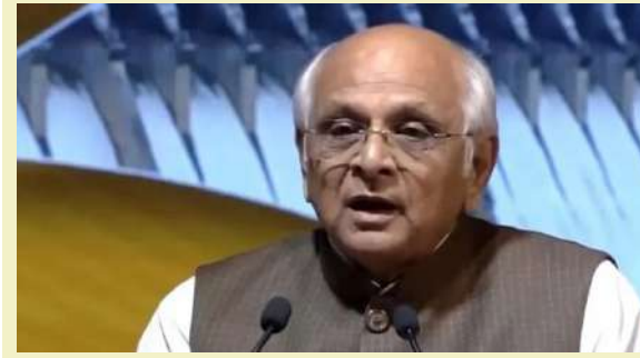
અને જાગૃતિનું મોટું માધ્યમ' ગણાવી બિરદાવી હતી. મુખ્યમંત્રી ભૂપેન્દ્ર પટેલે જણાવ્યું હતું કે, વડાપ્રધાન નરેન્દ્ર મોદીના જાહેર જીવનના ૨૪ વર્ષ પૂર્ણ થવાના ઉપલક્ષ્યમાં ઉજવાઈ રહેલા 'વિકાસ સમાહ'નો મૂળ મંત્ર 'વિકાસથી વિરાસત'ને સાકાર કરવાનો છે, અને ભજન-ભક્તિ આપણી આ અમૂલ્ય વિરાસત છે. મુખ્યમંત્રી ભૂપેન્દ્ર પટેલે ભજનની શક્તિ વર્ણવતા કહ્યું કે, જ્યારે અલગ-અલગ જાતિ, ધર્મ અને વર્ગમાંથી આવતી બહેનો એક સાથે ભજન ગાય છે, ત્યારે સર્વ ભેદભાવ ભૂલીને ભગવાનમય બની જાય છે, આ ભક્તિની ખરી તાકાત છે. ભજન

| પ્રતિનિધિ, મહેસાણા, તા.૧૩ | ગુજરાતની ધર્મમય અને ભક્તિસભર સંસ્કૃતિને વધુ મજબૂત કરવાના ઉદ્દેશ્ય સાથે, વિસનગરમાં 'આજની ઘડી તે રખિયામણી ભજન સંધ્યા' દિવ્ય કાર્યક્રમ યોજાયો હતો. આ પ્રસંગે મુખ્યમંત્રી ભૂપેન્દ્ર પટેલે ભજન મંડળીઓને સામાજિક સમરસતા અને જાગૃતિ ફેલાવવાનું એક મોટું માધ્યમ ગણાવી તેમનું વિશેષ સન્માન કર્યું હતું. વિસનગર ખાતે 'આજની ઘડી તે રખિયામણી ભજન સંધ્યા' કાર્યક્રમ યોજાયો હતો. જેમાં મુખ્યમંત્રી ભૂપેન્દ્ર પટેલના હસ્તે સામાજિક વિષયો પર ભજન સ્પર્ધાના વિજેતાઓને સન્માનિત કરવામાં આવ્યા હતા. મુખ્યમંત્રી ભૂપેન્દ્ર પટેલે ભજન મંડળીઓને 'સામાજિક સમરસતા