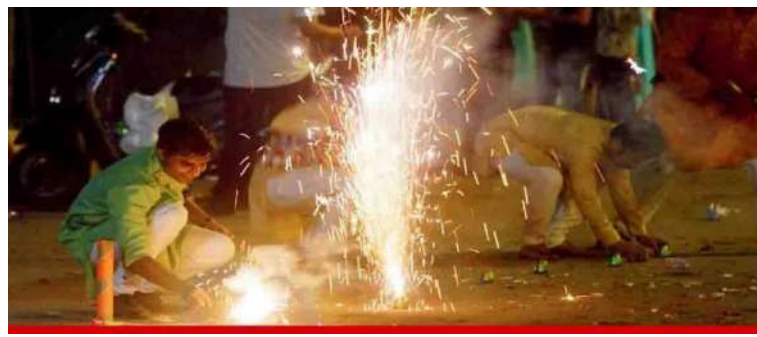
૧. સુપ્રીમ કોર્ટ દ્વારા ગ્રીન તથા માન્યતા પ્રાપ્ત ફટાકડા કે જે ઓછા એનિશન ઉત્પન્ન કરે છે તેના ઉત્પાદન અને વેચાણની પરવાનગી આપવામાં આવેલ છે. આ સિવાયનાં તમામ પ્રકારનાં ફટાકડાનાં ઉત્પાદન અને વેચાણ પર નામ.સુપ્રીમ કોર્ટ દ્વારા પ્રતિબંધ મુકવામાં આવેલ છે. ૨. ભારે ઘોષ્ટાટવાળા ફટાકડા સ્વાસ્થ્ય માટે ખૂબ જ હાનિકારક હોવાથી તથા વધુ પ્રમાણમાં હવાનું પ્રદુષણ અને ઘન કચરો પેદા કરતાં બાંધેલા ફટાકડા પર સુપ્રીમ કોર્ટ દ્વારા પ્રતિબંધ મુકવામાં આવેલ છે.

માર્ગદર્શિકા જાહેર કરાઈ છે. જે મુજબ, રાત્રે ૮ થી ૧૦ વાગ્યા દરમિયાન જ ફટાકડા ફોડી શકાશે. દિવાળી દરમિયાન જાહેરમાં ફટાકડા ફોડવા બાબતે સૂચનાઓ જાહેર કરાઈ છે. ગૃહ વિભાગે જાહેરમાં ફટાકડા ફોડવા બાબતે સૂચનાઓ જાહેર કરી છે. સુપ્રીમ કોર્ટના નિર્દેશ મુજબ નિશ્ચિત સમયમાં જ ફટાકડા ફોડી શકાશે. રાત્રે ૮ થી ૧૦ દરમિયાન ફટાકડા ફોડી શકાશે. વધુ ઘોષ્ટ કરતા ફટાકડા ફોડવા પર પ્રતિબંધ મૂકાયો છે. તેમજ ફટાકડા ઈ કોમર્સ વેબસાઈટ પર પણ વેચાણ નહિ થઈ શકે. સરકારની શું છે ગાઈડલાઈન