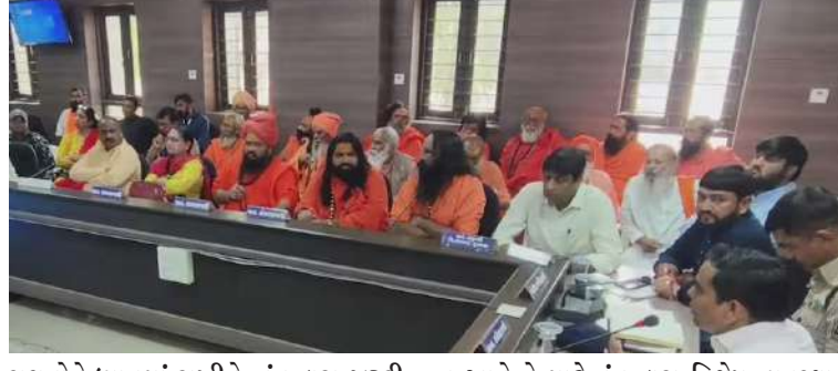
સૂચનોને ધ્યાનમાં રાખીને, તંત્ર દ્વારા જરૂરી વ્યવસ્થા જાળવવા અને અમલવારી કરવા માટે સૂચનાઓ આપવામાં આવી છે. લીલી પરિક્ષા દરમિયાન ભાવિકોને મુશ્કેલી

1 પ્રતિનિધિ, જુનાગઢ, તા.૧૬ | જિલ્લા વહીવટી તંત્ર દ્વારા ગિરનારની લીલી પરિક્ષાની તૈયારીઓ અંગે બેઠકનું આયોજન કરવામાં આવ્યું હતું. આ બેઠકમાં સાધુ-સંતો, ઉત્તારા મંડળ અને સામાજિક સંસ્થાના અગ્રણીઓ હાજર રહ્યા હતા. પરિક્ષાના આયોજનને લઈને સાધુ-સંતો તથા અગ્રણીઓએ વિવિધ સૂચનો આપ્યા છે. કારતક સુદ અગિયારસથી શરૂ થનાર ગિરનારની પરિક્ષાને લઈને વહીવટી તંત્રની બેઠક યોજાઈ હતી. જેમાં વિવિધ સૂચનો અંગે ચર્ચા કરવામાં આવી હતી. તંત્ર દ્વારા જે વ્યવસ્થા કરવામાં આવી છે તેની માહિતી આપવામાં આવી હતી. તેમાં