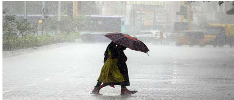
૭ વાગ્યે નાવ કાસ્ટ બુલેટિન પણ જાહેર કર્યું છે, જે મુજબ આગામી ત્રણ કલાક દરમિયાન અમરેલી, ગીર સોમનાથ અને દીવમાં ભારે પવન અને ગાજવીજ સાથે ભારે વરસાદની આગાહી છે અને અહીં રેડ એલર્ટ યથાવત છે. ઉપર જણાવેલા ઓરેન્જ એલર્ટ ધરાવતા તમામ જિલ્લાઓ અને સંઘ પ્રદેશોમાં મધ્યમ વરસાદની સંભાવના છે.

। પ્રતિનિધિ, અમદાવાદ, તા.૨૬ । રાજ્યમાં છેલ્લા ૨૪ કલાકમાં અચાનક વાતાવરણમાં પલટો આવતા ૨૫ જેટલા તાલુકાઓમાં કમોસમી વરસાદ (માવડું) પડ્યો છે. ખેડૂતોને પાકને નુકસાન થવાની ભીતિ સતાવી રહી છે, ત્યારે હવામાન વિભાગે આગામી ૪ દિવસ સુધી રાજ્યમાં હજુ ભારે વરસાદની આગાહી કરી છે. કમોસમી વરસાદને પગલે હવામાન વિભાગે જુદા જુદા વિસ્તારો માટે રેડ, ઓરેન્જ અને યલો એલર્ટ જાહેર કર્યા છે. હવામાન વિભાગના જણાવ્યા અનુસાર, ભારે પવન અને ગાજવીજ સાથે કમોસમી વરસાદ વરસી શકે છે. આ સંદર્ભમાં રેડ એલર્ટ: અમરેલી, ગીર સોમનાથ અને સંઘ પ્રદેશ દીવ માટે ભારેથી અતિભારે વરસાદની સંભાવનાને પગલે 'રેડ એલર્ટ' જાહેર કરવામાં આવ્યું છે. ઓરેન્જ એલર્ટ: જુનાગઢ, ભાવનગર, ભરૂચ, નર્મદા, સુરત, તાપી, ડાંગ, નવસારી, વલસાડ તેમજ દમણ, દાદરા અને નગર હવેલી માટે મધ્યમ વરસાદ સાથે 'ઓરેન્જ એલર્ટ' જાહેર કરાયું છે. યલો એલર્ટ: પોરબંદર, રાજકોટ, સુરેન્દ્રનગર, ભોટાદ, અમદાવાદ, આણંદ, વડોદરા, છોટાઉદેપુર, પંચમહાલ, દાહોદ, ખેડા અને મહીસાગર જિલ્લામાં હળવા વરસાદ સાથે 'યલો એલર્ટ' જાહેર કરવામાં આવ્યું છે. હવામાન વિભાગે સવારે