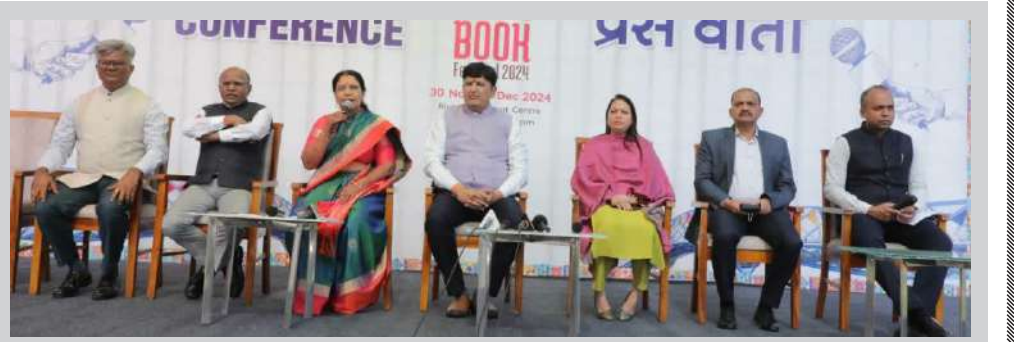
એઆઈ, કામ જનાલિંગમ, ગાંધી-મંડેલા લેગસી પર લાઇવ સેશન યોજાશે