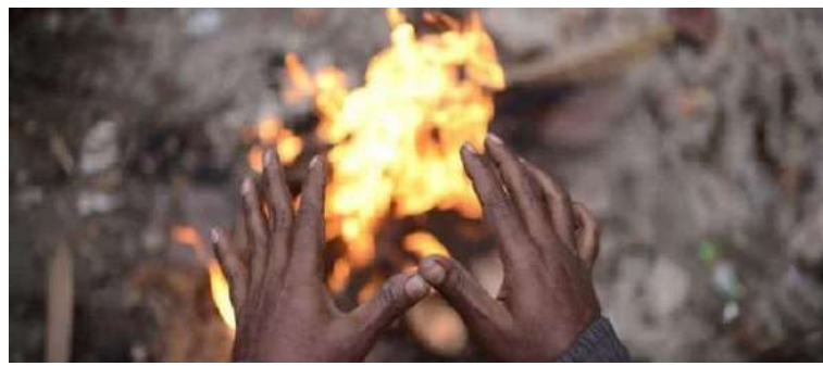
હવે ભુજમાં લઘુત્તમ તાપમાન ૧૮.૮ ડિગ્રી, કંડલા પોર્ટ પર ૨૧ ડિગ્રી અને કંડલા એરપોર્ટ પર ૧૮.૪ ડિગ્રી લઘુત્તમ તાપમાન નોંધાયું હતું. જિલ્લામાં વહેલી સવારે અને રાત્રે ઠંડક જ્યારે બપોરે ગરમીનો અનુભવ થવા લાગ્યો છે. માવડાની અસર ઉતર્યા બાદ આખરે ગુજરાતના દ્વારે શિયાળાએ ટકોરા મારવાનું શરુ કરી દીધું છે. હવામાન વિભાગની આગાહી મુજબ રાજ્યમાં આગામી ૩ દિવસ દરમિયાન તાપમાનમાં ૨થી ૩ ડિગ્રીનો ઘટાડો નોંધાયો, જેના કારણે ઈંડીના પ્રમાણમાં નોંધપાત્ર વધારો અનુભવાશે. ગુરુવાર રાત્રિએ નલિયામાં ૧૫.૫ ડિગ્રી લઘુત્તમ તાપ માન નોંધાયું હતું, જે રાજ્યનું સૌથી નીચું તાપમાન હતું. હવામાન વિભાગે આગાહી કરી છે કે આગામી ૩ દિવસમાં અમદાવાદનું લઘુત્તમ તાપમાન ૨૦ ડિગ્રીથી નીચે જવાની શક્યતા છે. ગત રાત્રિએ શહેરમાં ૨૧.૧ ડિગ્રી તાપમાન નોંધાયું હતું, જે સામાન્ય કરતાં ૨.૧ ડિગ્રી ઓછું હતું. એ જ રીતે, નલિયાનું તાપમાન પણ સામાન્ય કરતાં ૨.૫ ડિગ્રી ઓછું રહ્યું હતું.

ડિગ્રી તાપમાન નોંધાયું હતું, જે સામાન્ય કરતાં ૨.૧ ડિગ્રી ઓછું હતું. એ જ રીતે, નલિયાનું તાપમાન પણ સામાન્ય કરતાં ૨.૫ ડિગ્રી ઓછું રહ્યું હતું. કચ્છ જિલ્લામાં હાલ વાતાવરણીય વિષમતાને કારણે ભેવડી ઋતુનો અહેસાસ થઈ રહ્યો છે. કારતક મહિનાના બીજા પખવાડિયાની શરુઆતે જ તાપમાનમાં ઠોંઠથી સાડા ત્રણ ડિગ્રીનો ઘટાડો થતાં ઈંડીની શરુઆત થઈ છે. નલિયામાં સાડા ત્રણ ડિગ્રીના ઘટાડા સાથે પારો ૧૫.૫ ડિગ્રી સેલ્સિયસ પર સ્થિર થતાં તે રાજ્યનું સૌથી ઠંડુ મથક બન્યું હતું. તો બીજા તરફ ભુજમાં મહત્તમ તાપમાન ૩૪.૮ ડિગ્રી નોંધાતા તે રાજ્યનું સૌથી ગરમ મથક બન્યું