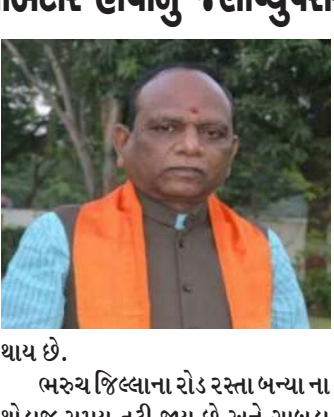
ભરૂચ જિલ્લાના રોડ રસ્તા બન્યા ના થોડાજ સમય તૂટી જાય છે અને ગાબડા

સાંસદ મનસુખભાઈ વસાવાએ ફરી એકવાર રોડ રસ્તાના મુદ્દે રાજકીય દબાણ ને જવાબદાર ઠેરવ્યા. તેમણે રોડ રસ્તા ની ગુણવત્તા માટે રાજકીય અગ્રણીઓના દબાણને જવાબદાર ઠેરવ્યા. વધુમાં તેમણે રાજકીય અગ્રણીઓની ક્વોરી માલિકો સાથે સંદર્ભોનો ક્યાં આક્ષેપ કર્યો હતો. સરકારના પારદર્શક વહીવટ કરે છે પરંતુ કેટલાક રાજકીય આગેવાનો ની મિલિભગત ના કારણે સરકાર બદનામ