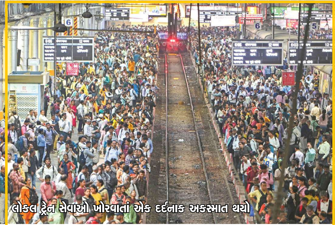
લોકલ ટ્રેન સેવાઓ ખોરવાતાં એક દર્દનાક અકસ્માત થયો