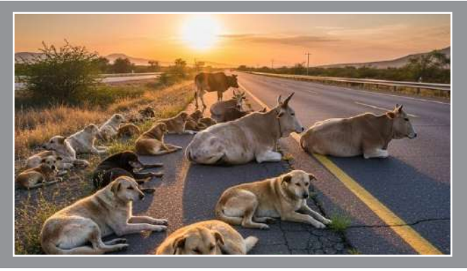
કડાયેલા ફૂતરા તે જ વિસ્તારમાં પાછા છોડવા ન આવે. બીજી તરફ સુપ્રીમ કોર્ટે રાજસ્થાન હાઇકોર્ટના ચુકાદાને દોહરાવતા કહ્યું હતું કે, હાઇવે અને એક્સપ્રેસવે પરથી પણ રખડતાં ટોર અને પ્રાણીઓને દૂર કરો અને તેમને આશ્રયસ્થાનોમાં મોકલો. કોર્ટે અધિકારીઓને એવા હાઇવેના વિસ્તારોને ઓળખવા માટે એક ખાસ

। એજન્સી, નવી દિલ્હી, તા. ૭ । સુપ્રીમ કોર્ટે દેશભરમાં શૈક્ષણિક સંસ્થાઓ, હોસ્પિટલો અને હાઇવે અને રસ્તાઓ સહિત સંસ્થાકીય સ્થળોએ રખડતાં ફૂતરા કરડવાના કેસોમાં થઈ રહેલા વધારાની ગંભીર નોંધ લીધી છે. સુપ્રીમ કોર્ટના જસ્ટિસ વિક્રમ નાથ, સંદીપ મહેતા અને એન. વી. અંજીરિયાની બેન્ચે આ અંગે મહત્વના નિર્દેશો જાહેર કર્યા છે. બેન્ચે તમામ સંબંધિત અધિકારીઓને આદેશ આપ્યો છે કે તે સરકારી અને ખાનગી શૈક્ષણિક સંસ્થાઓ તેમજ હોસ્પિટલોના પરિસરમાં રખડતાં ફૂતરાને પ્રવેશતા અટકાવવા માટે તાત્કાલિક પગલાં લે, જેથી તેમના હુમલા રોકી શકાય. સુપ્રીમ કોર્ટની બેન્ચે જણાવ્યું હતું કે, આવા સંસ્થાકીય પરિસરોમાંથી પ કડાયેલા રખડતા ફૂતરાને નિયુક્ત આશ્રયસ્થાનોમાં લઈ જવા જોઈએ. આ ઉપરાંત કોર્ટે સ્પષ્ટપણે જણાવ્યું છે કે પ