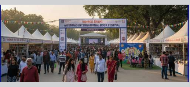
અમદાવાદ ઇન્ટરનેશનલ બુક ફેસ્ટિવલ ૨૦૨૫ દરમિયાન સાંસ્કૃતિક કાર્યક્રમોનું પણ આયોજન કરવામાં આવ્યું

ડાન્સ-ડ્રામા જેવા કાર્યક્રમોનો સમાવેશ થાય છે. ઝોન ૨ - જ્ઞાન ગંગા, જેમાં રોજિંદા લેખન અને ડિઝાઇન સ્ટુડિયો (સવારે ૧૦ થી સાંજે ૫) ગણલ, કવિતા, ડ્રામા, ફિલ્મ-સ્ક્રિપ્ટ, નિબંધ, બાયોગ્રાફી વર્કશોપ, હેન્ડ્સ-ઓન પ્રવૃત્તિઓ જેમ કે ફેબ્રિક પેપર, ઝાઈન મેકિંગ, ટેરાકોટા હોર્સ, માતા-ની-પચ્છેડી, ઓઈલ પેઇન્ટિંગ, મેટલ એમ્બોસિંગનો સમાવેશ થાય છે. જ્યારે ઝોન ૩ - સ્કૂલ બોર્ડ શતાબ્દી મહોત્સવ પેવેલિયનમાં ઇન્ટર-સ્કૂલ મેગા ક્રોસ્ટરના સિટી લેવલના ફાઈનલ રાઉન્ડ (સવારે ૧૦ થી સાંજે ૭:૩૦) યોજાશે. મુખ્ય આકર્ષણો અને ઇન્ટર-સ્કૂલ મેગા ક્રોસ્ટરની વાત કરીએ તો, ૧૩ અને ૧૪ નવેમ્બર ક્રિકેટ, ૧૫ નવેમ્બર વાર્તાકથન (જીંગીલ્સ/કથા), ૧૬ નવેમ્બર ફેન્સી ડ્રેસ, ૧૭ નવેમ્બર ક્રિડ્સ પેનલ ડિસ્કશન, ૧૮ નવેમ્બર ઇન્ટર-સ્કૂલ ક્રોસ્ટર, ૧૯ નવેમ્બર ઇમ્પ્રોવિઝેશન, ૨૦ નવેમ્બર બુક રીડિંગ ક્રોસ્ટર તેમજ ૨૧ નવેમ્બર મસ્તી કી પાર્ટીના મુખ્ય આકર્ષણો રહેશે. આ ઉપરાંત વિજેતાઓને ઈનામો અને ટ્રોફી એનાયત કરવામાં આવશે. અમદાવાદ મ્યુનિસિપલ કોર્પોરેશન અને નેશનલ બુક ટ્રસ્ટ ઇન્ડિયાના સંયુક્ત ઉપક્રમે આયોજિત આ ફેસ્ટિવલમાં નિ:શુલ્ક ચિલ્ડ્રન્સ ફિલ્મ ફેસ્ટિવલનું આયોજન કરવામાં આવ્યું છે, જેમાં રોજ સાંજે પ.૩૦ થી ૭.૩૦ દરમિયાન અંદાજિત ૪ થી ૭ વર્ષના રાષ્ટ્રીય સુરક્ષર વિજેતા ફિલ્મોનું પ્રદર્શન થશે.