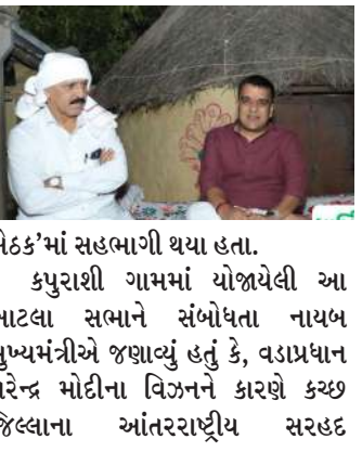
હર્ષ સંઘવીએ ઉમેર્યું હતું કે, સરહદી ગામોનો વિકાસ કેવી રીતે કરી શકાય તે ઉદ્દેશ સાથે ૩૦થી વધુ સીનિયર પોલીસ અધિકારીઓ સરહદી ગામોમાં સભા સંવાદ યોજીને નાગરિકોની સમસ્યાઓથી અવગત થયા છે.

રાજ્યના નાયબ મુખ્યમંત્રી હર્ષ સંઘવી ભારત-પાકિસ્તાન સરહદી ગામોની સીમાવર્તી સમીક્ષા, સામાજિક-આર્થિક સ્થિતિ અને રહેણીકરણી સહિતની વિવિધ બાબતોથી અવગત થવા તેમજ "સરકાર આપને ઘર"ના ધ્યેયમંત્રને અર્પિત કરવા માટે કચ્છની મુલાકાતે છે. આ મુલાકાત દરમિયાન તેઓ કચ્છના લખપત તાલુકાના કપુરાશી ગામ ખાતે કપુરાશી અને કોરિયાણી ગ્રામજનો સાથે સંવાદ કરીને 'ખાટલા