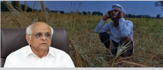
ખેડૂત દેવામાં ડૂબી જશે તો આત્મહત્યાનો દોર ગુજરાતમાં વધારે ચાલશે । દ્વારકામાં ખેડૂતે આત્મહત્યા કરી

થયું છે એના માટે કશું નથી. સમાજના સુષ્ટિઓ સમાજના ઉદ્યોગ તિઓએ આગળ આવવું જોઈએ. સરકારે પોતાની મર્યાદા બતાવી દીધી કે બે હેક્ટર વેસા આપી શકીશું. સમાજે હવે આગળ આવવું પડશે. ખેડૂતોમાં સરકારના પેકેજથી અસંતોષ છે. ખેડૂતોમાં આક્રોશ છે. જો ખેડૂતો આગળ આવશે તો ભારતીય કિસાન સંઘ પણ ખેડૂતોના પડખે રહેશે. આર.કે પટેલે કહ્યું કે, સરકારે જે આધારે આ પેકેજ જાહેર કર્યું છે તેનો આધાર મૂકવું જોઈએ. ખેડૂતો માટે ઘાસચારો પણ ન આવે એ પ્રકારનું પેકેજ છે. સરકારે પુનઃ વિચાર કરવાની અમારી માંગ છે. સરકારે પિયત અને બિન પીયતની બાબત કાઢી નાંખી એ આવકારદાયક છે. તો બીજી તરફ, ખેડૂતોને સરકારે આપેલી સહાય સામે કોંગ્રેસ નેતા અમિત ચાવડાએ આકરા પ્રકાર કરતા કહ્યું કે, રાજ્યના દરેક ખેડૂતના માથે ૫૬ હજારનું દેવું છે. ખેડૂતોની વધારે આવવાને બદલે ખેડૂતોને સરકાર પડીકું આપી રહી છે. આજે જગતનો તાત તમામ રીતે હેરાન છે અને આર્થિક રીતે પાયામાલ છે. રાજ્યમાં ત્રણ દાયકાથી ભાજપનું શાસન છે. એક તરફ રૂઠી છે અને સરકાર દયાહીન દેખાઈ રહી છે. સરકાર કહે છે ઐતિહાસિક પેકેજ જાહેર કર્યું છે. પરંતુ ખેડૂતો કહે છે આ પેકેજ નહીં પડીકું છે.