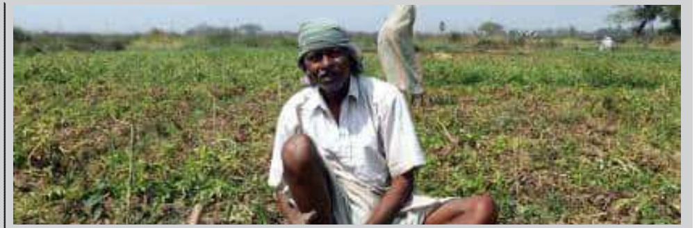
ખેડૂતોના માસ સમૂહમાં મદદ કરી છે તે આવકારદાયક છે

ખેડૂત દેવામાં ડૂબી જશે તો આત્મહત્યાનો દોર ગુજરાતમાં વધારે ચાલશે. દ્વારકામાં ખેડૂતે આત્મહત્યા કરી. સાચા અર્થમાં સરકાર ખેડૂત વિરોધી છે. ખેડૂતોના સંપૂર્ણ દેવા માફ કરવા કોંગ્રેસની માંગ છે. જો દેવા માફી નહીં આપવામાં આવે તો આગામી સમયે કોંગ્રેસ ખેડૂતો સાથે રહી આંદોલન કરશે. પાક વીમો નથી જેના કારણે સરકાર સામે ખેડૂતોએ ભીખ માંગી પડે છે. ગુજરાતમાં પાક વીમા લાગુ કરવામાં આવે. સરકારે રાહત પેકેજ અંગે પુનઃ વિચારણા કરવાની જરૂર છે.