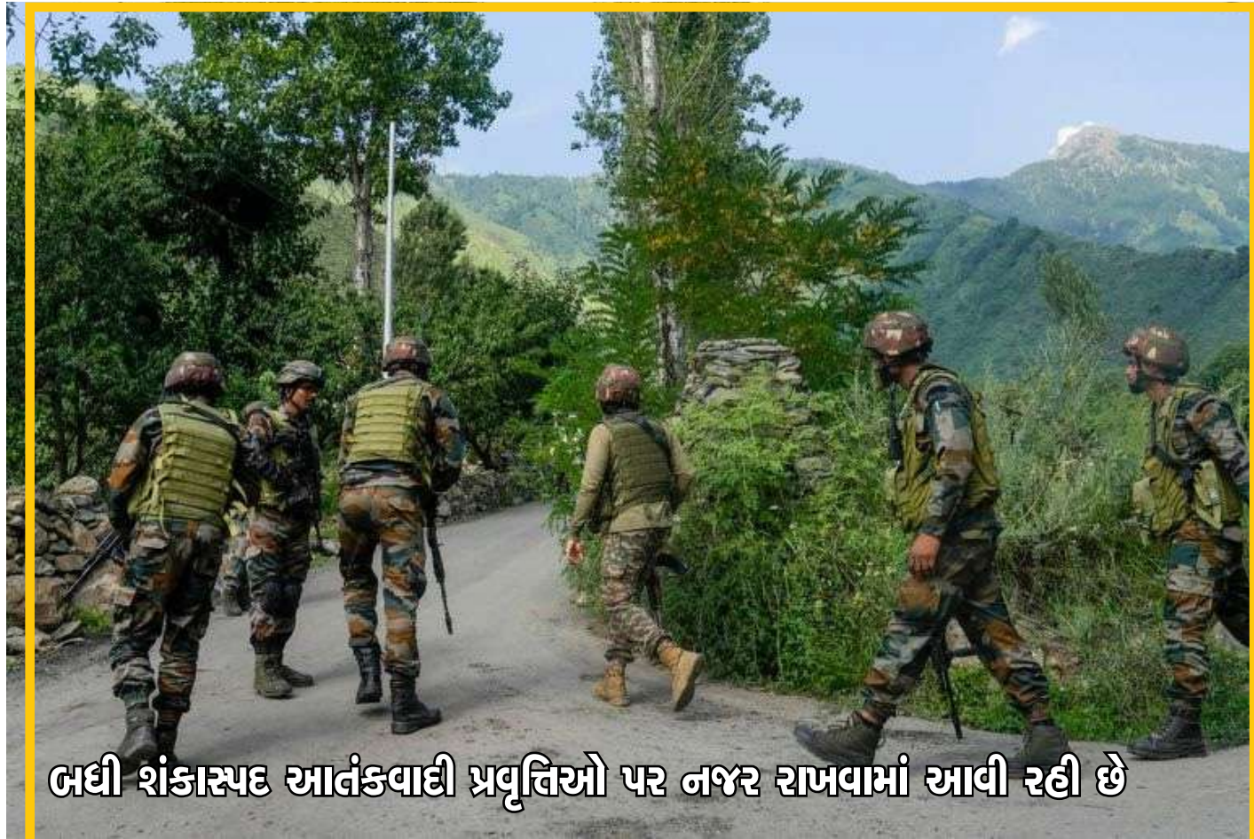
બધી શંકાસ્પદ આતંકવાદી પ્રવૃત્તિઓ પર નજર રાખવામાં આવી રહી છે