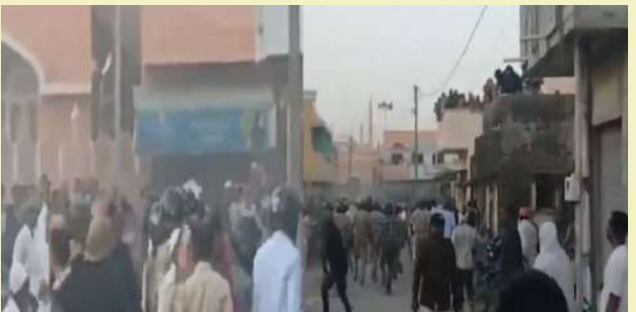
પર પથ્થરમારો કરતાં સ્થિતિ બેકાબૂ બની હતી. આ દરમિયાન પોલીસે નજીક દુકાનો, મકાનો અને ધાર્મિક સ્થળ પરના દબાણો હટાવવાની કામગીરી હાથ ધરી હતી. કોઈ અકવામાં ન આવે અને ગેરકાયદે પ્રવૃત્તિમાં ન જોડાવવા લોકોને અપીલ.' ગીર સોમનાથમાં સરકારી જમીન પર ગેરકાયદે બાંધકામ કરાયેલા ધાર્મિક સ્થળની ડિમોલિશનની

। પ્રતિનિધિ, ગીર સોમનાથ, તા.૧૦ । ગીર સોમનાથમાં સરકારી જમીન પર ગેરકાયદે બાંધકામ કરાયેલા ધાર્મિક સ્થળની ડિમોલિશનની કામગીરી દરમિયાન પોલીસ પર પથ્થરમારો કરાયો હોવાની ઘટના સામે આવી છે. ટોળાએ પોલીસ પર પથ્થરમારો કરતાં પોલીસે લાકીયાજી ક્યો અને ટીચરગેસના ૩ છોડીને ટોળાને વિખેરવાનો પ્રયાસ કર્યો હતો.