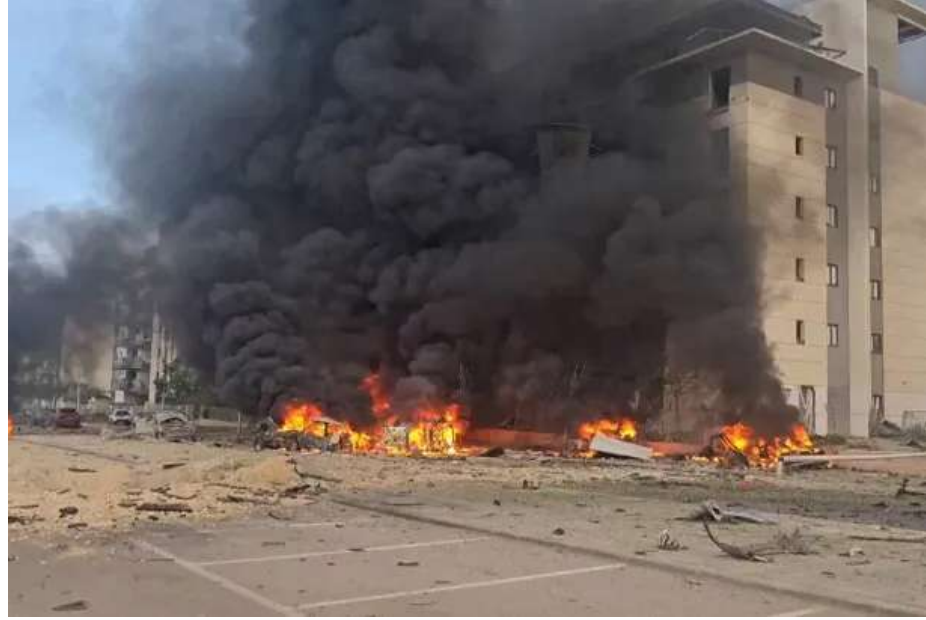
તેલ અવીવ : ઈરાનનું પીઠબળ પામેલા આતંકી જૂથ ઈઝબુલ્લાહે દક્ષિણ લેબેનોનમાં લશ્કરી ટ્રષ્ટિએ મહત્વનાં તેવા બાંધકામો ઉપર ગઈકાલે (ગુરુવારે) વ્યાપક હવાઈ હુમલા કરી તે બાંધકામો તોડી ફોડી નાખ્યા હતાં આથી ઈઝબુલ્લાહની બાંધકામ પ્રવૃત્તિ અટકી ગઈ છે. આ હુમલા કરતાં પૂર્વે ઈઝરાયેલે આતંકી મથકો નજીક આવેલા તેબેહ, તાયીર ડેબ્બા અને આયાત-અલ-જબર ગામોના રહેવાસીઓને તે ગામો છોડી ગામથી ઓછામાં ઓછા ૫૦૦ મીટર દૂર ચાલ્યા જવા જણાવ્યું હતું. આ ચેતવણી કર્યા બાદ અલબત્તે ઈઝરાયેલે આતંકી મથકોને આક્રમણ કર્યું હતું. ઈઝરાયેલે જ પહેલા યુદ્ધ વિરામ ભંગ કર્યો હોવાથી તેને શિક્ષા કરવા અમારે આ પગલું ભરવું પડ્યું છે. ઈઝરાયેલના આ હુમલાને લીધે એક જણનું મૃત્યુ થયું હતું. કેટલાક ઘાયલ પણ થયા હતા. જોકે ઘાયલોનો સાચો આંક અને મૃતકોનો સાચો આંક તો પછીથી જાણવા મળશે. ઈઝરાયેલ સેનાના કર્નલ ખદ્રાઈએ વધુમાં કહ્યું હતું કે, ઈઝબુલ્લાહ જો હુમલા કરશે તો તેમને વળતો ખતરનાક જવાબ અપાશે.