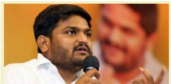
આપવા અને અન્ય વિવિધ કલમો હેઠળ ગુનો નોંધવામાં આવ્યો હતો. આ કેસમાં અગાઉ હાર્દિક પટેલ અમુક મુદત સુધી કોર્ટમાં હાજર ન રહેતા તેમની સામે ધરપકડ વોરંટ પણ જાહેર કરવામાં આવ્યું હતું. જોકે, પાછળથી આ વોરંટ ગુજરાત હાઈકોર્ટમાંથી રદ કરાવવામાં આવ્યું હતું. ત્યારબાદ, હાર્દિક પટેલ આજે અમદાવાદ ગ્રામ્ય

। પ્રતિનિધિ, અમદાવાદ, તા.૧૯ । વર્ષ ૨૦૧૫ના પાટીદાર અનામત આંદોલન સંબંધિત નિકોલ પોલીસ મથકે નોંધાયેલા કેસમાં, વર્તમાનમાં વિરમગામના ભારતીય જનતા પાર્ટીના ધારાસભ્ય અને આંદોલનના નેતા હાર્દિક ભરતભાઈ પટેલ સહિત અન્યો સામે અમદાવાદ ગ્રામ્ય મેજિસ્ટ્રેટ કોર્ટ (તહેમતનામું) ફરમાવ્યું છે. કોર્ટના આ નિર્ણય બાદ હવે હાર્દિક પટેલ સામે કેસની ટ્રાયલની કાર્યવાહી ૨૧મી નવેમ્બરથી શરૂ થશે, જેમાં સાક્ષીઓની જુબાની નોંધવામાં આવશે.