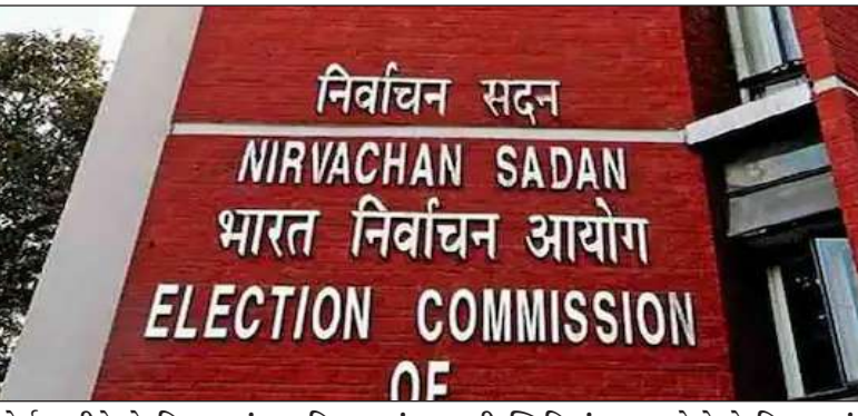
ફોર્મ ભરીને તે વિસ્તારમાં સબમિટ કરવું જોઈએ જ્યાં તેઓ મતદાર રહેવા માંગે છે. જો ઉત્તર પ્રદેશમાં કોઈ રહેવાસી મુંબઈ, દિલ્હી અથવા દેશના અન્ય કોઈ શહેરમાં રહે