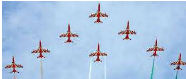
આકાશમાં તિરંગો, દિલનો આકાર, ડાયમંડ ફોર્મેશન, બેરલ રોલ, લૂપ, વર્ટિકલ ચાર્જી જેવા અત્યંત જોખમી અને દર્શનિદન કરતબો રજૂ કરશે. ધુમાડાથી ભનેલો વિશાળ તિરંગો

। પ્રતિનિધિ, રાજકોટ, તા.૧૯ । વર્ષના અંતમાં રાજકોટવાસીઓને એક અવિસ્મરણીય ભેટ મળવા જઈ રહી છે. આવતીકાલે નહીં, પરંતુ ૭ ડિસેમ્બર, ૨૦૨૫ના રોજ રાજકોટના આકાશમાં ભારતીય વાયુસેનાની વિશ્વવિખ્યાત 'સૂર્યકિરણ ટીમ' દિલ્હી સ્ટેડિયમ અને અવનવા કરતબો રજૂ કરશે. નવ બીએઈ હોક વિમાનોની ચોકસાઈ, ઝડપ અને સૌંદર્યનો અદ્ભુત સંગમ જોવા લાખો લોકો ઉમટી પડે તેવી શક્યતા છે.