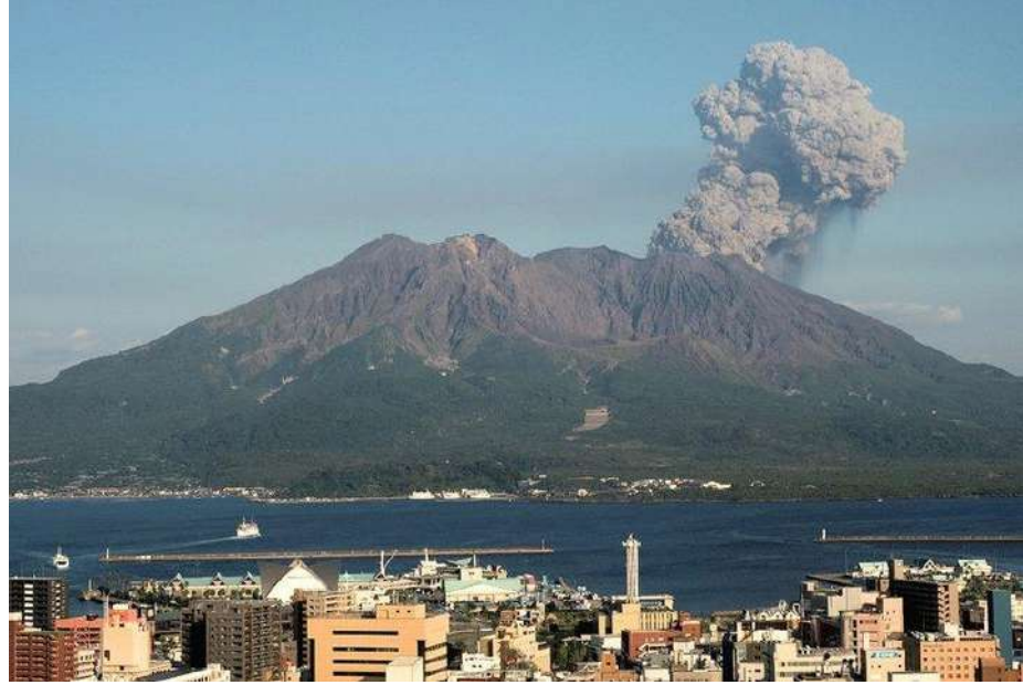
ટોક્યો : જાપાનના દક્ષિણપશ્ચિમ ક્યુશુમાં સાકુરાજીમા જ્વાળામુખી ૧૬ નવેમ્બર, ૨૦૨૫ ના રોજ સવારે એક પ્રચંડ વિસ્ફોટ સાથે ફાટી નીકળ્યો, જેનાથી જ્વાળામુખીની રાખ અને ધુમાડાનો મોટો ગોળો ૪,૪૦૦ મીટર (આશરે ૧૪,૪૦૦ ફુટ) ની ઊંચાઈ સુધી ફેલાયો. મિનામિડાકે ખાડાથી શરૂ થયેલા આ વિસ્ફોટથી દૂર દૂર સુધી મોટી માત્રામાં રાખ ફેલાઈ ગઈ, જેના કારણે કાગોશિમા, કુમામોટો અને મિયાઝાકી સહિત આસપાસના અનેક પ્રદેશોમાં રાખ પડવાની ચેતવણી આપવામાં આવી. સ્થાનિક સમય સુજાપ રાત્રે આશરે ૧૨:૫૦ વાગ્યે જ્વાળામુખી ફાટવાની શરૂઆત થઈ, ત્યારબાદ બપોરે ૨:૨૮ વાગ્યે બીજો, વધુ શક્તિશાળી વિસ્ફોટ થયો, જેનાથી ૩,૭૦૦ મીટર ઉંચો ધુમાડો નીકળ્યો. લગભગ ૧૩ મહિનામાં આ પહેલી વાર હતું જ્યારે જ્વાળામુખીની રાખનો ગોળો ૪ કિલોમીટરથી વધુ ઉંચો પહોંચ્યો, જે તાજેતરની પ્રવૃત્તિની તુલનામાં એક શક્તિશાળી વિસ્ફોટ હતો. જ્વાળામુખીના ખડકો ખાડાથી ૧.૨ કિલોમીટર દૂર સુધી બહાર નીકળ્યા હતા, જે વિસ્ફોટોની તીવ્રતા દર્શાવે છે. વિસ્ફોટોની વિકરાળતા હોવા છતાં, જાનહાનિ અથવા પાયરોક્લાસ્ટિક પ્રવાહ, ગરમ ગેસ અને જ્વાળામુખી પદાર્થોના ખતરનાક રીતે ઝડપી પ્રવાહોના કોઈ અહેવાલ નથી.