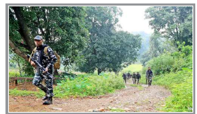
મજબૂત કમાન્ડ ધરાવતો હતો. તેમણે એકાઉન્ટરમાં સાત માઓવાદીઓ માર્યા ગયા હોવાના અહેવાલ આપ્યા હતા. વધુમાં, આંધ્રપ્રદેશ પોલીસે રાજ્યના વિવિધ પ્રદેશોમાંથી આશરે ૫૦ સીપીઆઈ (માઓવાદી) કેડરની ધરપકડ કરી છે. આ કાર્યવાહી કૃષ્ણા, એલુરુ, એનટીઆર વિજયવાડા, કાકીનાડા અને ઓ. બીઆર આંબેડકર કોનાસીમા જિલ્લામાં કરવામાં આવી હતી. આનાથી માઓવાદી સંગઠનના દક્ષિણ ભસ્તર અને ઈડકોટ્ટપ્પ નેટવર્કને મોટો ફટકો પડ્યો છે. પોલીસના જણાવ્યા અનુસાર, ધરપકડ કરાયેલા લોકોમાં વરિષ્ઠ માઓવાદીઓ, સંદેશાવ્યવહાર નિષ્ણાતો, સશસ્ત્ર પ્લાટૂન સભ્યો અને પાર્ટીના સભ્યોનો સમાવેશ થાય છે. તે બધા સીપીઆઈ-માઓવાદી પાર્ટીની સેન્ટ્રલ કમિટીના સભ્ય માધવી હિડમા સાથે નજીકથી કામ કરતા હતા. ઉલ્લેખનીય છે કે ૧ કરોડ રૂપિયાનું ઈનામ ધરાવતો નક્સલી માધવી હિડમા મંગળવારે છત્તીસગઢ-આંધ્રપ્રદેશ સરહદ પર એક એકાઉન્ટરમાં માર્યા ગયા હતા. આ એકાઉન્ટરમાં હિડમા અને તેની પત્ની રાજે ઉર્ફે રાજકા સહિત કુલ છ નક્સલીઓ માર્યા ગયા હતા.

। એજન્સી, સમસ્ત્રાવતી, તા.૧૯ । પતરનાક માઓવાદી માદવી હિડમાની હત્યાના એક દિવસ પછી, સુરક્ષા દળો આંધ્ર પ્રદેશમાં તેમની કામગીરી ચાલુ રાખી રહ્યા છે. રાજ્યના મારેડુમિલી વિસ્તારમાં એકાઉન્ટરમાં સાત માઓવાદીઓ માર્યા ગયા હોવાના અહેવાલ છે. આંધ્રપ્રદેશ ઈ-ટેલિવિઝન એડીજી મહેશ ચંદ્ર લદાએ એક પ્રેસ કોન્ફરન્સ દરમિયાન જણાવ્યું હતું કે માર્યા ગયેલા માઓવાદીઓમાં ત્રણ મહિલાઓનો સમાવેશ થાય છે. તે બધાની ઓળખ કરવામાં આવી રહી છે. પોલીસના જણાવ્યા અનુસાર, માર્યા ગયેલા માઓવાદીઓમાં મેટુરી બોબા રાવ ઉર્ફે ટેક શંકરનો સમાવેશ થાય છે. તે શ્રીકાકુલમનો રહેવાસી હતો અને આંધ્ર-ઓડિશા સરહદનો જવાબદાર હતો. તે ટેકનિકલ નિષ્ણાત હતો અને શસ્ત્રો અને સંદેશાવ્યવહારનો મજબૂત કમાન્ડ ધરાવતો હતો.