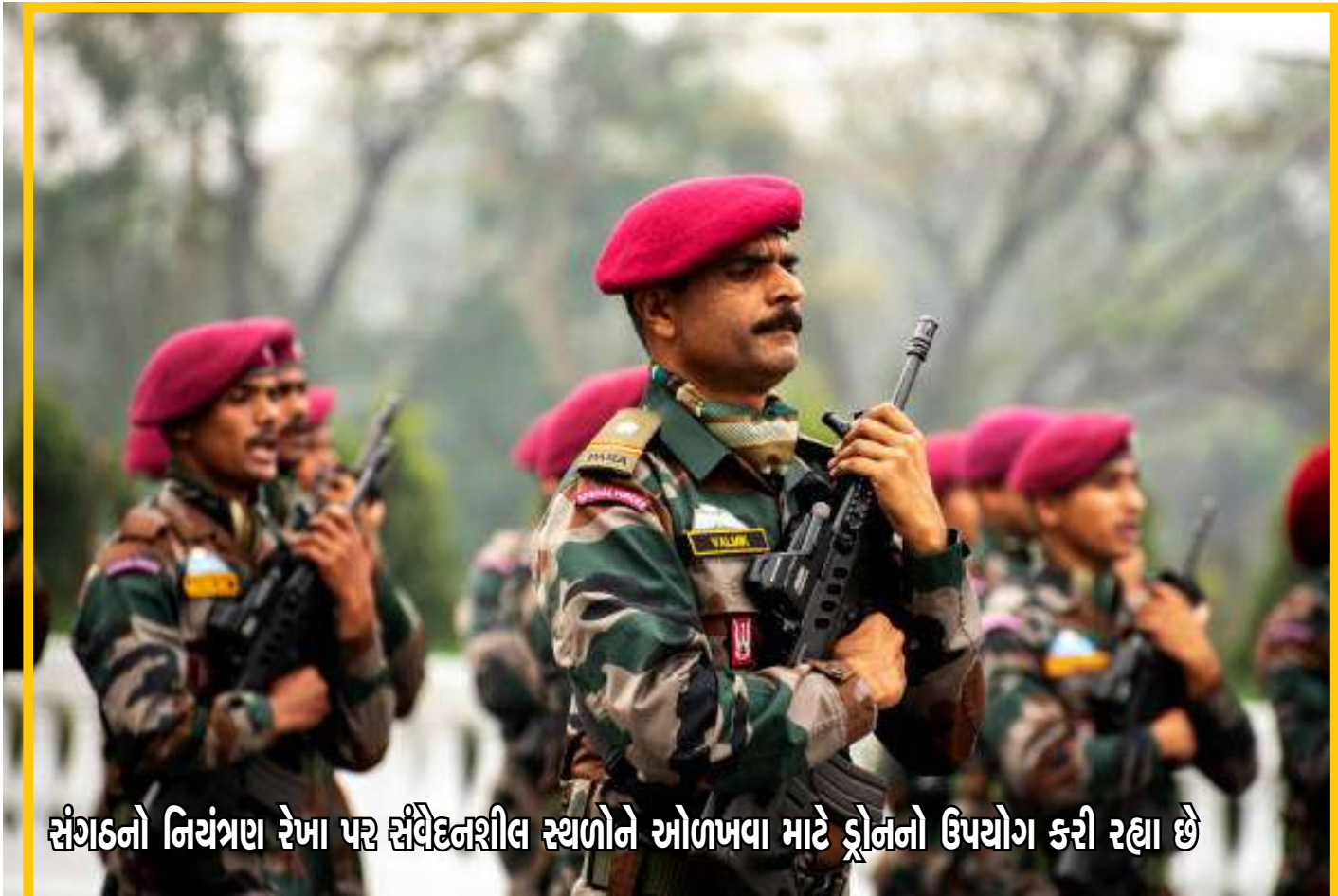
સંગઠનો નિયંત્રણ રેખા પર સિવેદનશીલ સ્થળોને ઓળખવા માટે ડ્રોનનો ઉપયોગ કરી રહ્યા છે