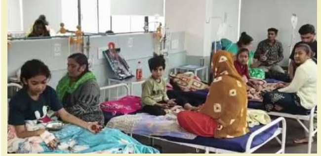
હોવાનું જાણવા મળી રહ્યું છે. છેલ્લા ૨૪ કલાકમાં જ વધુ ૧૮ બાળકોને હોસ્પિટલમાં દાખલ કરવામાં આવ્યા છે. આ આખી ઘટનામાં તંત્રની ગુનાહિત બેદરકારી સામે આવી છે. આરોગ્ય વિભાગે ૩૦ ડિસેમ્બરના રોજ જ ગાંધીનગર મહાનગરપાલિકાને લેખિતમાં જાણ કરી હતી કે શહેરમાં પાણીજન્ય રોગચાળો ફેલાઈ રહ્યો છે. તેમ છતાં, પાલિકા તંત્ર ધોર નિદ્રામાં રહ્યું અને કોઈ નક્કર પગલાં ન લેવાયા, જેનું પરિણામ આજે ગાંધીનગરની જનતા ભોગવી રહી છે. તપાસમાં સામે આવ્યું છે કે પાટનગરના વિવિધ વિસ્તારોમાં અંદાજે ૧૯ થી ૨૦ જેટલી જગ્યાએ પીવાના પાણીની લાઈનમાં લીકેજ છે. આ લીકેજને કારણે ગટરનું ગંદુ પાણી ત્રી

। પ્રતિનિધિ, ગાંધીનગર, તા.૫ । રાજ્યના પાટનગરમાં પાણીજન્ય રોગચાળાએ અત્યંત ભયાનક સ્વરૂપ ધારણ કર્યું છે. ખાસ કરીને જૂના સેક્ટરો અને આસપાસના વિસ્તારોમાં ટાઈફોઈડના કેસોમાં મોટો ઉછાળો આવતા આરોગ્ય તંત્ર દોડતું થઈ ગયું છે. સિવિલ હોસ્પિટલમાં દર્દીઓનો એવો ધસારો છે કે બેડ ખૂટી પડ્યા છે અને તાત્કાલિક ધોરણે વધારાનો વોર્ડ શરૂ કરવાની ફરજ પડી છે. પાટનગરમાં પ્રસારેલા આ રોગચાળામાં અત્યાર તલમાં દાખલ કરવામાં આવ્યા છે. આ આખી ઘટનામાં તંત્રની ગુનાહિત બેદરકારી સામે આવી છે. આરોગ્ય વિભાગે ૩૦ ડિસેમ્બરના રોજ જ ગાંધીનગર મહાનગરપાલિકાને લેખિતમાં જાણ કરી હતી કે શહેરમાં પાણીજન્ય રોગચાળો ફેલાઈ રહ્યો છે.