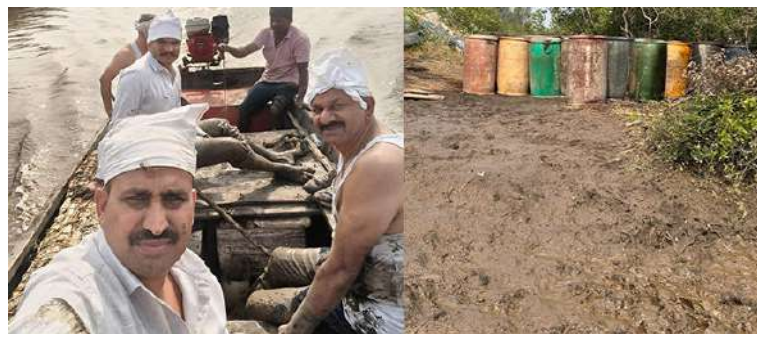
દેવાની ફિરાકમાં હોવાનું સામે આવ્યું હતું. તેવામાં સુરત પોલીસને તપાસ દરમિયાન મધ દરિયા ટાપુના કિનારાના વિસ્તારમાંથી ચોરી કર્યા બાદ આરોપીઓ નાના બેરલમાં ડીઝલ ભરીને સસ્તા ભાવે બારોબાર વેચી મળી આવ્યો હતો. પોલીસે આશરે ૩.૧૦ લાખની કિંમતના કુલ ૭૫ થી વધુ જેટલા બેરલ કબજે કર્યા છે. પોલીસની કામગીરી દરમિયાન ડીઝલની ચોરીને અંજામ

પોર્ટ કે મગદલા પોર્ટ પર ઉદ્યોગ માટે આવતા મોટા જહાજ મધદરિયે ઉભા રહે છે. આ જહાજોમાંથી છેલ્લા કેટલાક સમયથી ડીઝલ સહિતની વસ્તુઓની ચોરી થતી હોવાની પોલીસ કમિશનરને ફરિયાદ મળી હતી. જેમાં સુરત નજીક મધદરિયા પાસે ટાપુમાં ચોરીને અંજામ આપતી ગેંગ સક્રિય થઈ હોવાની માહિતીની આધારે પોલીસે તપાસ હાથ ધરી હતી. પોલીસ દ્વારા મધદરિયે તપાસ કરતાં એક જહાજમાંથી ઈલેક્ટ્રિક મોટર લગાવીને પાઈપલાઈન થકી ડીઝલ તેવામાં સુરત પોલીસને તપાસ દરમિયાન મધ દરિયા ટાપુના કિનારાના વિસ્તારમાંથી ચોરી કર્યા બાદ આરોપીઓ નાના બેરલમાં ડીઝલ ભરીને સસ્તા ભાવે બારોબાર વેચી