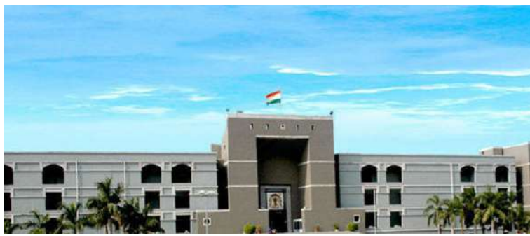
ગણાવી રદબાતલ ઠરાવ્યો હતો અને ઠરાવ્યું હતું કે, સંમતિપૂર્વકના છૂટાછેડાના કિસ્સામાં છ મહિનાનો ફૂલિંગ ઓફ પિરિયડ (જતો) કરી શકાય છે અને તે ફરજિયાત નથી. ગુજરાત હાઈકોર્ટના આ ચુકાદાને પગલે જે કેસોમાં પતિ-પત્ની વચ્ચે સમાધાન શક્ય જ નથી અને તેઓ કોઈપણ સંજોગોમાં પરસ્પર સંમતિથી છૂટાછેડા લેવા માંગે છે

ના હોય અને બંનેએ મક્કમતાપૂર્વક છૂટા પડવાનું નક્કી કર્યું હોય તો તેવા સંજોગોમાં છ મહિનાનો આ ફૂલિંગ ઓફ પિરિયડ જતો કરી શકાય છે. ગુજરાત હાઈકોર્ટે સંમતિપૂર્વકના આવા જ એક છૂટાછેડાના કેસમાં બહુ મહત્વનો ચુકાદો આપતા સ્પષ્ટપણે ઠરાવ્યું છે કે, સંમતિપૂર્વકના છૂટાછેડા માટે છ મહિનાનો ફૂલિંગ ઓફ પિરિયડ ફરજિયાત નથી. જસ્ટિસ સંગીતા કે. વિશેષ અને જસ્ટિસ નિશા એમ. ઠાકરની બંડપીઠે આ અગત્યનો ચુકાદો આપતા એક દંપતિના પરસ્પર સંમતિથી છૂટાછેડા માટેની અરજી કલમ-૧૩ બી હેઠળની નામંજૂર કરવાના ફેમીલી કોર્ટના હુકમને અયોગ્ય