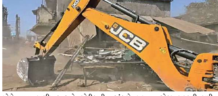
મોજે નાના પાળીયાદ અને ચોટીલાની સરકારી જમીન પરના દબાણો દૂર કરાયા ચોટીલાની સરકારી જમીન પર મકતિયાપ કરવામાં આવતા કિંમત રૂ. ૧૦૫ કરોડની

। પ્રતિનિધિ, સુરેન્દ્રનગર, તા.૧૧ । સુરેન્દ્રનગર જિલ્લાનું પ્રસિદ્ધ યાત્રાધામ ચોટીલા, જ્યાં માં ચામુંડાના દર્શનાર્થે પ્રતિદિન હજારો શ્રદ્ધાળુઓ ઉમટી પડે છે. ત્યાં આજે વહીવટી તંત્ર દ્વારા એન્ટિહાસિક ઓપરેશન હાથ ધરવામાં આવ્યું હતું. વર્ષોથી ડુંગરની તળેટી અને હાઈવે સુધીના મુખ્ય માર્ગ પર જમાવાયેલા ગેરકાયદે દબાણને દૂર કરવા માટે મેગા ડિમોલીશનની કામગીરી હાથ ધરી ૪૦૦થી વધુ ગેરકાયદે દબાણ પર જેસીબી ફેરવી દઈ રૂ. ૧૦૫ કરોડની ૧૭ એકર સરકારી જમીન ખુલ્લી કરવાઈ હતી. તેમજ નવગૃહ મંદિરના કંપાઉન્ડમાં ત્રણ માળનું ગેસ્ટ