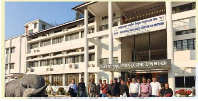
દીમાપુર એરપોર્ટ ખાતે નાગાલેન્ડના પીઆઈબી વિભાગે ગુજરાતના પત્રકારોનું ભવ્ય સ્વાગત કર્યું હતું. દેશના પત્રકારો એક બીજા રાજ્યના પત્રકારો અને સ્થાનિક માહિતી અને સંસ્કૃતિથી વાકેફ થઈ શકે તે માટે અમદાવાદ પીઆઈબી દ્વારા ખાસ આયોજન કરવામાં આવ્યું છે.

। પ્રતિનિધિ, કોહિમા, તા.૧૯ । ગુજરાતના પત્રકારો નાગાલેન્ડની દૂર જોડાયા છે અને વિવિધ સ્થળોની માહિતી લીધી છે. વિવિધ સરકારી પ્રોજેક્ટો અને હેરિટેજ વિલેજની ગુજરાતી પત્રકારોએ માહિતી મેળવી છે. દિમાપુર એરપોર્ટ ખાતે નાગાલેન્ડના પીઆઈબી વિભાગે ગુજરાતના પત્રકારોનું ભવ્ય સ્વાગત કર્યું હતું. દેશના પત્રકારો એક બીજા રાજ્યના પત્રકારો અને સ્થાનિક માહિતી અને સંસ્કૃતિથી વાકેફ થઈ શકે તે માટે અમદાવાદ પીઆઈબી દ્વારા ખાસ આયોજન કરવામાં આવ્યું છે. આ દૂરમાં ગુજરાતના વિવિધ મીડિયા સાથે સંકળાયેલા પત્રકારો જોડાયા છે. દીમાપુર એરપોર્ટ પર તેમના આગમન સમયે, ૧૩ વરિષ્ઠ પત્રકારો અને બે અધિકારીઓ સહિતની આ