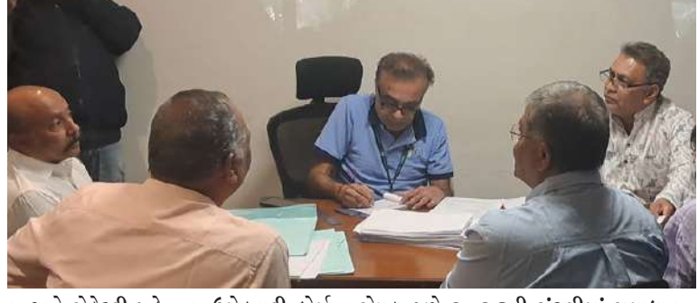
૯ અને સેકેટરી પટે - ૯ ઉમેદવારી ફોર્મ અને બાકીના ફોર્મ અલગ અલગ હોદાઓ માટે ભરાયા છે. ઉલ્લેખનીય છે કે, અગાઉ વખતની ચૂંટણીમાં તેઓ ફરી સામસામે આવશે કે કોઈ નવા સમીકરણો રચાશે તે

બાબતે ભારે ચર્ચા ચાલી રહી છે. આ ચૂંટણી માટે ફોર્મ જમા કરાવવા આજે અંતિમ દિવસે મોટી સંખ્યામાં ઉમેદવારો અને તેમના સમર્થકો પહોંચે તે નક્કી હતું. તેમ છતાં આગોતરું આયોજન ન કરતા ઉમેદવારોએ વ્યવસ્થાઓ અંગે સવાલો ઉઠાવ્યા હતા. ફોર્મ સ્વીકારવા માટે માત્ર એક જ કાઉન્ટર રાખવામાં આવતા વિલંબ થયો હતો. ઉમેદવારોની રજૂઆત બાદ બીજું કાઉન્ટર શરૂ કરાયું હતું. આ ઉપરાંત સિનિયર સિટીઝન માટે ખેસવાની અપૂરતી વ્યવસ્થા હોવાથી અનેક લોકોને ઓફિસની બહાર ઊભા રહેવાની નોંખત આવી હતી.