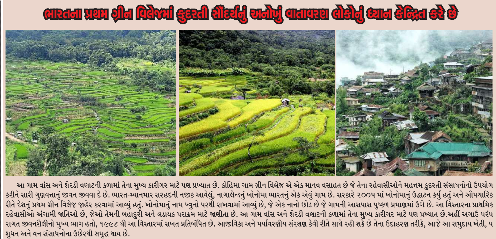
આ ગામ વાંસ અને શેરડી વણાટની કળામાં તેના મુખ્ય કારીગર માટે પણ પ્રખ્યાત છે. કોહિમા ગામ ગ્રીન વિલેજ એ એક માનવ વસાહત છે જે તેના રહેવાસીઓને મહત્તમ કુદરતી સંસાધનોનો ઉપયોગ કરીને સારી ગુણવત્તાનું જીવન જીવવા દે છે. ભારત-મ્યાનમાર સરહદની નજીક આવેલું, નાગાલેન્ડનું ખોનોમા ભારતનું એક એવું ગામ છે. સરકારે ૨૦૦૫ માં ખોનોમાનું ઉદ્ઘાટન કર્યું હતું અને ઔપચારિક રીતે દેશનું પ્રથમ ગ્રીન વિલેજ જાહેર કરવામાં આવ્યું હતું. ખોનોમાનું નામ ખુનો પરથી રાખવામાં આવ્યું છે, જે એક નાનો છોડ છે જે ગામની આસપાસ પુષ્કળ પ્રમાણમાં ઉગે છે. આ વિસ્તારના પ્રાથમિક રહેવાસીઓ અંગામી જાતિઓ છે, જેઓ તેમની બહાદુરી અને લડાયક પરાક્રમ માટે જાણીતા છે. આ ગામ વાંસ અને શેરડી વણાટની કળામાં તેના મુખ્ય કારીગર માટે પણ પ્રખ્યાત છે. અહીં અગાઉ પરંપરાગત અર્થવ્યવસ્થા જીવનશૈલીનો મુખ્ય ભાગ હતો, ૧૯૮૮ થી આ વિસ્તારમાં સમ્પત્તિ પ્રતિબંધિત છે. આજીવિકા અને પર્યાવરણીય સંરક્ષણ કેવી રીતે સાથે રહી શકે છે તેના ઉદાહરણ તરીકે, આજે આ સમુદાય ખેતી, પશુપાલન અને વન સંસાધનોના ઉછેરથી સમૃદ્ધ થાય છે.

અહીંના લોકો ચોરી કે લૂંટની ચિંતા કર્યા વિના તેમના ઘરો અને વ્યવસાયોને તાળા મારતા નથી અને તેમને અડધા વિના છોડતા નથી. ૨૦૧૧ ની વસ્તી ગણતરી મુજબ, ૪૨૪ પરિવારો ધરાવતા આ ગામમાં અખંડિતતાની એક અનોખી સંસ્કૃતિ છે જે સમય જતાં ટકી રહી છે. આજે ખોનોમા ગામમાં પ્રવાસીઓને ફક્ત લીલા વાતાવરણ અને અદભૂત દૃશ્યો સિવાય બીજું બધું માણે છે. સમુદાય તેની આસપાસના વાતાવરણ સાથે શાંતિથી કેવી રીતે સહઅસ્તિત્વ કરી શકે છે તે શીખવામાં રસ ધરાવતા કોઈપણ વ્યક્તિ આ ખુલ્લા વર્ગખંડમાં હાજરી આપવા માટે આવકાર્ય છે. પછી ભલે તે સમુદાય દ્વારા સંરક્ષિત જંગલ હોય, તેના રહેવાસીઓનો દયાળુ સ્વભાવ હોય કે ગામનો ઈકોટુરિઝમ મોડેલ તરીકેનો દરજ્જો હોય, ખોનોમા એક એવું સ્થળ છે જે અહીં આવનાર દરેક વ્યક્તિ પર છાપ પાડશે. નાગાલેન્ડનું ખોનોમા ગામમાં શુદ્ધ કુદરતી ઓકિસજનનો ખજાનો છે, અહીંની હવા એટલી શુદ્ધ છે કે લોકો અહીં પ્રકૃતિ બની જાય છે. નાગાલેન્ડના પહાડી વિસ્તારમાં આવેલ આ ગામ પ્રવાસીઓની પહેલી પસંદગી બન્યું છે, સાથે સાથે કુદરતી પ્રકૃતી પ્રેમીઓ માટે ફરવાનું અદભૂત સ્થળ બન્યું છે. ભારતના પ્રથમ ગ્રીન વિલેજમાં કુદરતી સૌંદર્યનું અનોખું વાતાવરણ લોકોનું ધ્યાન કેન્દ્રિત કરે છે.