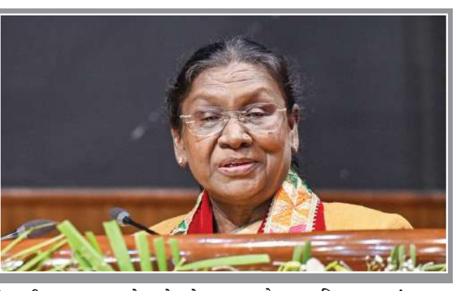
બંધારણીય ફરજ પણ છે અને દરેક નાગરિકે આ જવાબદારી પ્રત્યે સભાન રહેવું જોઈએ.'

। એજન્સી, નવી દિલ્હી, તા.૨૫ । રાષ્ટ્રપતિ ટ્રોપીકી મુમુએ રવિવારે દિલ્હી ખાતે આયોજિત ૧૬મા રાષ્ટ્રીય મતદાતા દિવસના કાર્યક્રમમાં નાગરિકોને સંબોધિત કરતા લોકશાહીના પર્વમાં ઉત્સાહભેર ભાગ લેવા અપીલ કરી હતી. તેમણે આશા વ્યક્ત કરી હતી કે, ભારતીય નાગરિકો કોઈપણ પ્રકારના લોભ-લાલચ, પૂર્વગ્રહ અથવા ખોટી માહિતીથી પ્રભાવિત થયા વગર પોતાના વિવેકબુદ્ધિથી મતાધિકારનો ઉપયોગ કરશે, જેનાથી દેશની ચૂંટણી પ્રણાલી વધુ મજબૂત બનશે. આ પ્રસંગે રાષ્ટ્રપતિએ ખાસ કરીને મહિલા મતદારોની પ્રશંસા કરી હતી. તેમણે જણાવ્યું હતું કે, 'નાજેતરની ચૂંટણીઓમાં મહિલાઓ જે રીતે મોટી સંખ્યામાં મતદાન કરવા આગળ આવી રહી છે તે લોકશાહી માટે પ્રોત્સાહક છે. મતદાન એ માત્ર અધિકાર નથી પરંતુ એક મહત્વપૂર્ણ