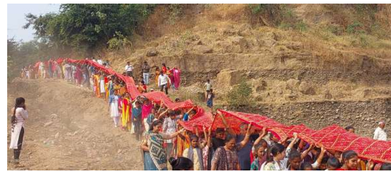
હતા, ત્યારે તેમના પરસેવાના ટીપામાંથી એક ડુંડ રચાયો અને તેમાંથી એક કન્યાનો જન્મ થયો, જે નર્મદા તરીકે ઓળખાયા. શિવજીના આદેશથી તેઓ રેવા (અવાજ) કરતા વહેવા લાગ્યા, તેથી તેમનું નામ 'રેવા' પણ પડ્યું. મૈકલ પર્વતમાંથી ઉદ્ભવતા હોવાથી તેમને 'મૈકલ સુતા' પણ કહેવામાં આવે છે. ગંગામાં સ્નાન કરવાનું જે ફળ મળે

કિનારેથી સામે પાર રીંગણી ગામના કિનારા સુધી અર્પણ કરવામાં આવી હતી. આ ભવ્ય આયોજનમાં ૧૦૦૦થી વધુ શ્રદ્ધાળુઓ જોડાયા હતા. નદીની મધ્યધારામાં ૧૫ જેટલી નાવડીઓની મદદથી સાડીને એક છેડેથી બીજા છેડા સુધી ફેલાવી માતાજીને ઓઢાડવામાં આવી હતી. મંગોચ્ચાર અને 'નર્મદે સર્વદે'ના નાદ સાથે સમગ્ર વાતાવરણ ગુંજી ઉઠ્યું હતું. વિશેષ વાત એ છે કે, અર્પણ કર્યા બાદ આ સાડી ૫ માસમાં અહીં હજારો શ્રદ્ધાળુઓ પરિક્રમા માટે ઉમટી પડે છે. આજે નર્મદા જયંતિ નિમિત્તે સુરતથી પાસ મંગાવવામાં આવેલી ૧૫૦૦ ફૂટ લાંબી સાડી માંગરોળના