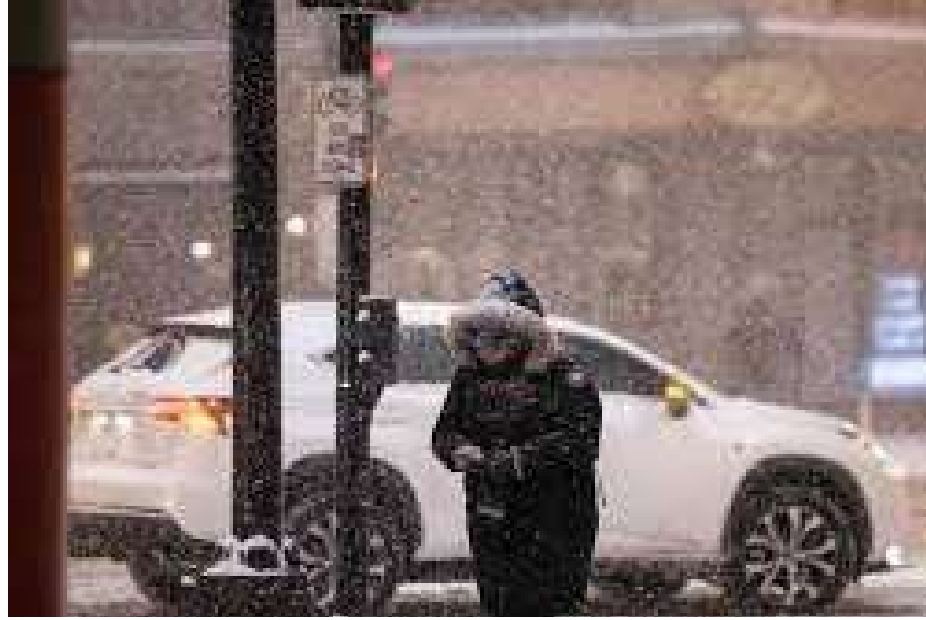
વોશિંગ્ટન : અમેરિકામાં હાલમાં કુદરતનો પ્રચંડ કહેર જોવા મળી રહ્યો છે. એક વિશાળ વિન્ટર સ્ટોર્મ (બરફનું તોફાન) અમેરિકાના અડધાથી વધુ ભાગને પોતાની લપેટમાં લીધો છે. ૨,૩૦૦ માઈલ સુધી ફેલાયેલા આ વાવાઝોડાએ પરિવહન અને વીજળી વ્યવસ્થાને સંપૂર્ણપણે ઠપ્પ કરી દીધી છે. પ્રમુખ ડોનાલ્ડ ટ્રમ્પે અનેક રાજ્યોમાં કટોકટી જાહેર કરી છે. અહેવાલો અનુસાર, અમેરિકામાં હિમવર્ષા અને વિજિલિયટી ઓછી હોવાને કારણે એવિએશન સેક્ટરને સૌથી મોટો ફટકો પડ્યો છે. ફ્લાઈટ અવરોધને કારણે અહવાલ મુજબ, શનિવાર અને રવિવાર દરમિયાન ૧૩,૦૦૦થી વધુ ફ્લાઈટ્સ રદ કરવામાં આવી છે. કોરોનાકાળ પછી એક જ દિવસમાં આટલી મોટી સંખ્યામાં ફ્લાઈટ્સ રદ થવાની આ પ્રથમ ઘટના છે. રસ્તાઓ પર બરફના જાડા થર જામી જવાથી વાહન વ્યવહાર જોખમી બન્યો છે. ભારે હિમવર્ષા અને પવનને કારણે વીજળીના ટાવરો અને વૃક્ષો ધરાશયી થયા છે. ટેક્સાસ અને લ્યુઈસિયાનામાં જ ૫૦,૦૦૦થી વધુ ઘરોમાં વીજળી ગુલ થઈ ગઈ છે. સમગ્ર અસરગ્રસ્ત વિસ્તારમાં અંદાજે ૧,૨૦,૦૦૦ ઘરો અંધારામાં રૂંધી ગયા છે. નેશનલ વેધર સર્વિસના જણાવ્યા મુજબ, અમેરિકાની અડધાથી વધુ વસ્તી આ તોફાનથી પ્રભાવિત છે. પરિસ્થિતિને પહોંચી વળવા માટે ફેડરલ ઈમરજન્સી મેનેજમેન્ટ એજન્સીએ રાહત સામગ્રી અને બચાવ ટીમો તહેનાત કરી દીધી છે.