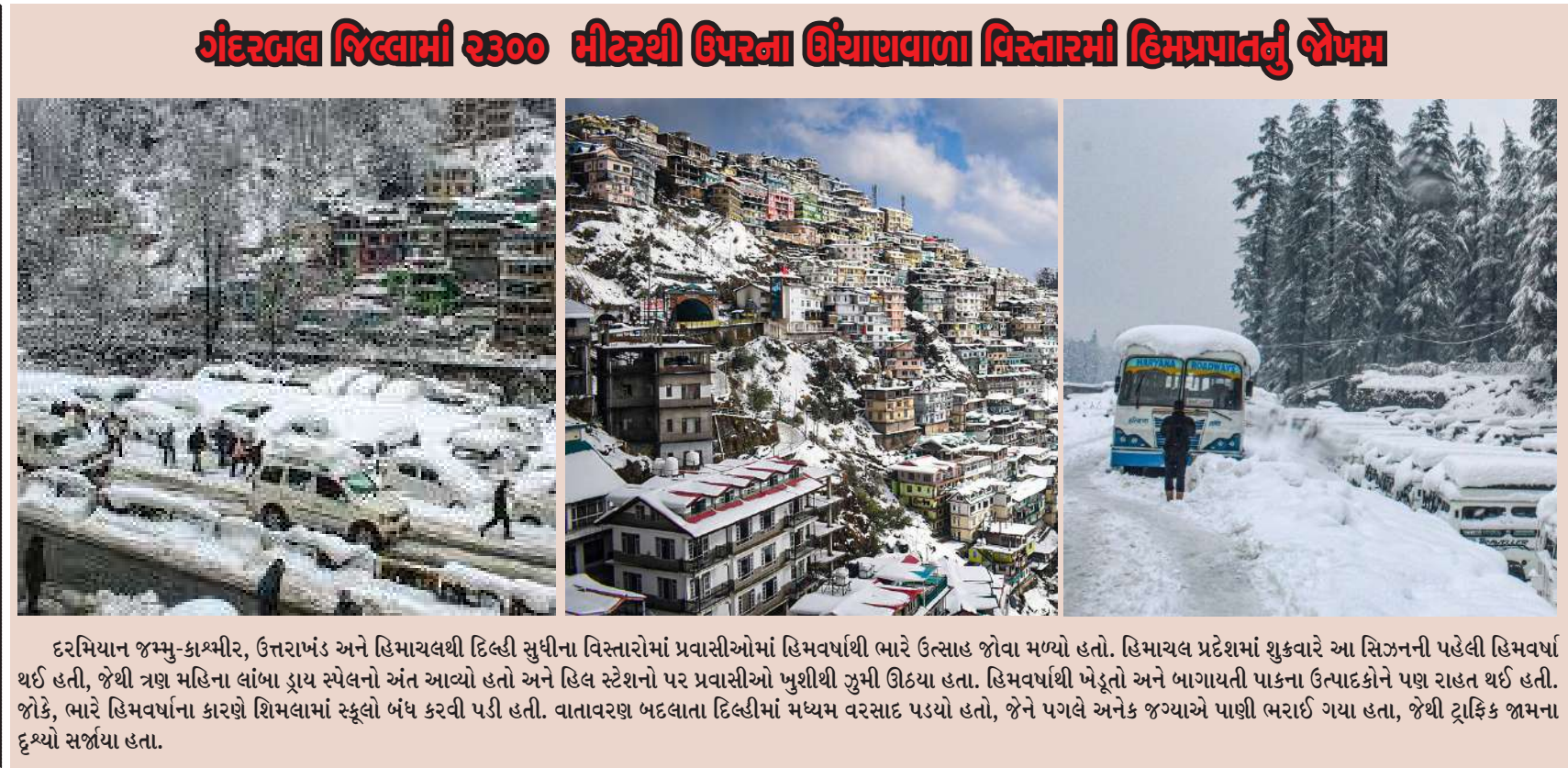
ગંદરબલ જિલ્લામાં ૨૩૦૦ મીટરથી ઉપરના ઊંચાણવાળા વિસ્તારમાં હિમપ્રપાતનું જોખમ

રહ્યો છે. હિમાચલ પ્રદેશના પડપ રસ્તાઓ પર વાહન વ્યવહાર ખોરવાયો છે. હવામાનની સ્થિતિ જતાં પૂંચમાં ૨૮ જાન્યુઆરી સુધી સ્વાસ્થ્ય કમંચારીઓની રજાઓ રદ કરી દેવાઈ હતી. હવામાન વિભાગે જણાવ્યું કે, જમ્મુ-કાશ્મીરના લગભગ બધા જ ભાગોમાં વરસાદ અને હિમવર્ષા થયા છે. પૂંચ અને ઉધમપુર જિલ્લાઓમાં ભરકાચઠાદિત વિસ્તારોમાં ૧૦૦થી વધુ પ્રવાસીઓ ફસાયા હતા જ્યારે મેદાની વિસ્તારોમાં મધ્યમ વરસાદના પગલે લગભગ બે મહિના કરતાં વધુ સમય સુધી ચાલેલો ડ્રાય સ્પેલ પૂરો થયો હતો. અંક પોલીસ અધિકારીએ કહ્યું કે, પૂંચ જિલ્લાના મેન્ચાર વિસ્તારમાં તોતાગાલિમાં ૭૦ લોકો ફસાયા હતા. તેમને વિપરિત હવામાન છતાં બચાવી લેવાયા હતા. ભારે હિમવર્ષાના કારણે કૃષ્ણા યાત્રીમાં અન્ય ૩૦થી વધુ પ્રવાસીઓ ફસાયા હતા. હિમવર્ષાના કારણે ભારત અને કાશ્મીર ખીણને જોડતો એકમાત્ર જમ્મુ-શ્રીનગર નેશનલ હાઈવે પણ બંધ કરી દેવાયો હતો, જેના પગલે હજારો વાહનો રસ્તામાં ફસાયા હતા. બીજાબાજુ કાશ્મીરમાં શુક્રવારે ભારે હિમવર્ષાના કારણે બધી જ ૨૦ ફ્લાઈટ્સ રદ કરી દેવાઈ હતી, જેથી હવાઈ ટ્રાફિક ખોરવાયો હતો. હિમવર્ષાના પગલે વિમાનો માટે રનવે અસલામત થઈ ગયો હતો. હવામાન વિભાગે જમ્મુ-કાશ્મીરના છ જિલ્લામાં હિમપ્રપાતની ચેતવણી આપી હતી. આગામી ૨૪ કલાકમાં ગંદરબલ જિલ્લામાં ૨૩૦૦ મીટરથી ઉપરના ઊંચાણવાળા વિસ્તારમાં હિમપ્રપાતનું જોખમ છે. ઉત્તરાખંડમાં પણ સિત્તનની પહેલી હિમવર્ષા થઈ હતી. જોકે, હવામાન વિભાગે અનેક વિસ્તારો માટે ઓરેન્જ એલર્ટ જાહેર કરી છે.