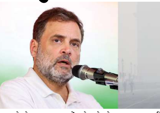
૯ વાગ્યે એક્યુઆર ૧૫૦ નોંધાયો હતો, જે મધ્યમ શ્રેણીમાં આવે છે. છેલ્લા સાડા ત્રણ કારણે ધૂળને રજકણો બેસી જવાથી લોકોને નીચી સપાટીએ પહોંચ્યો છે. રવિવારે લઘુતમ તાપમાન ૬.૬ ડિગ્રી સેલ્સિયસ નોંધાયું હતું, જે સામાન્ય કરતા ૦.૮ ડિગ્રી ઓછું છે. વરસાદને મહિનામાં પ્રથમ વખત શનિવારે છઠ્ઠી આટલી નીચી સપાટીએ પહોંચ્યો છે. રવિવારે લઘુતમ તાપમાન ૬.૬ ડિગ્રી સેલ્સિયસ નોંધાયું હતું.

। એજન્સી, નવી દિલ્હી, તા.૨૫ । કોંગ્રેસના પૂર્વ અધ્યક્ષ અને લોકસભામાં વિપક્ષના નેતા રાહુલ ગાંધીએ રાષ્ટ્રીય રાજધાની દિલ્હીમાં વાયુ પ્રદૂષણના ગંભીર મુદ્દે ફરી એકવાર ચિંતા વ્યક્ત કરી છે. તેમણે રવિવારે સોશિયલ મીડિયા પ્લેટફોર્મ એક્સ પર લખ્યું છે કે, 'આ પ્રદૂષણની આપણે ભારે કિંમત ચૂકવી રહ્યા છીએ, જેની અસર આપણા સ્વાસ્થ્ય અને દેશની અર્થવ્યવસ્થા એમ બંને પર પડી રહી છે.' રાહુલ ગાંધીએ એક લિંક શેર કરીને લોકોને વિનંતી કરી છે કે પ્રદૂષણને અટકાવવા માટે 'રાહુલ ગાંધીએ બાળકો, વૃદ્ધો, શ્રમિકોની ચિંતા વ્યક્ત કરી કહ્યું કે, 'જેરી હવાનો સૌથી વધુ ખરાબ અનુભવ બાળકો અને વૃદ્ધોને થઈ રહ્યો છે. પ્રદૂષણને કારણે લાદવામાં આતા પ્રતિબંધો અને ખરાબ હવાને લીધે આ ગરીબ વર્ગની આજીવિકા