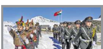
ત્રાસવાદી હુમલા બાદ કેટલીક બાબતો નક્કરપણે સપાટી પર આવી છે જેના તરફ ધ્યાન આપવામાં આવે તો કેટલાક અંશે ત્રાસવાદીઓને અને ત્રાસવાદી હુમલાને રોકી શકાય છે