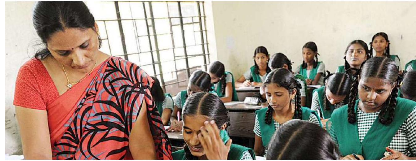
પ્રોફેસર ઓફ પ્રેક્ટિસ બનનારા વ્યાવસાયિક ત્રણ-ચાર વર્ષોના પોતાના સેવાકાળમાં પણ પોતાના અનુભવ, જ્ઞાન અને કૌશલ્યથી વિદ્યાર્થીઓના જ્ઞાન અને કૌશલ્યને વધારવામાં બહુ સહાયક થશે.

પ્રોફેસર ઓફ પ્રેક્ટિસ રૂપે કામ કરનારાઓ પાસે એ અપેક્ષા સ્વાભાવિક રહેશે કે તેઓ વિદ્યાર્થીઓને વ્યાવહારિક પ્રશિક્ષણ આપીને તેમને આત્મનિર્ભર બનાવવામાં સહયોગ કરે. સાથે જ ઉદ્યોગોની જરૂરિયાતો અને રાષ્ટ્રની જરૂરિયાતને અનુકૂળ વિદ્યાર્થીઓની અંદર કૌશલ્યનું નિર્માણ કરે. પ્રોફેસર ઓફ પ્રેક્ટિસ યોજનાની સાચકતા એના પર નિર્ભર કરશે કે તે વિદ્યાર્થીને વ્યાવહારિક પ્રશિક્ષણ, કૌશલ્ય અને રોજગારના કેટલા અવસર ઉપલબ્ધ કરાવે છે અને નવી પેઢીને ભવિષ્યમાં આવનારા પડકારો માટે કેટલી તૈયાર કરે છે. આજે શીખવાનું પરિવેશ ઝડપથી પરિવર્તિત થઈ રહ્યું છે. મૌખિકથી લેખિત થઈને આપણે ડિજિટલ દુનિયામાં દાખલ થઈ ગયા છી. તેથી હવે ડિજિટલ દુનિયાને અનુકૂળ વિદ્યાર્થીને કામ શીખવવું પડશે.