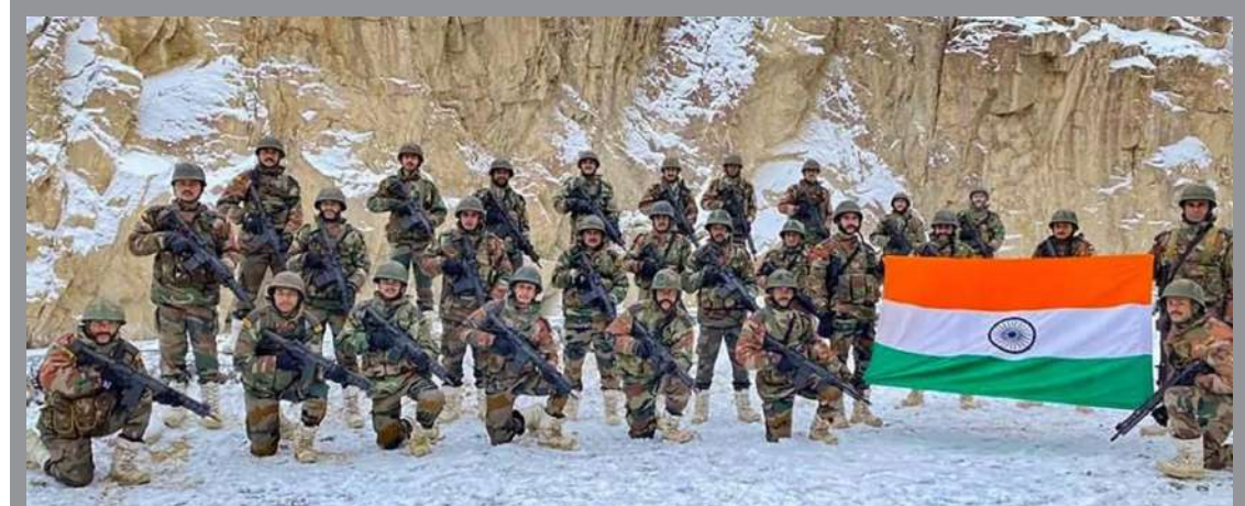
સુધી કોઈ વાત કરવાની સ્થિતિમાં નથી. અમારી ગુમચર સંસ્થાઓની ખામી રહી છે કે કેમ તે અંગે વાત કરવી યોગ્ય રહેશે નહીં. અમારી સરહદ પર અર્થલેક્ષકી જઈ નેનાત છે. જેમની જવાબદારી તેમના અધિકારીઓના બદલે પોલીસના હાથમાં હોય છે. અર્થલેક્ષકી દળમાં સીધી રીતે નિમણૂક પામેલાની તકોમાં કમી આવવાથી તેમના ટેશનમાં વધારો થાય છે. જો કે આવી કોઈ કામી રહી છે કે કેમ તે અંગે વાત કરવી હાલમાં યોગ્ય નથી. અંકુશ રેખા પર યોગ્ય વસવાટ ગોઠવીને કેટલીક સમસ્યાનો તો પોતાની રીતે જ ઉકેલ લાવી શકાય છે. પૂર્વ જવાનોને તેમના પરિવાર સાથે ગોઠવી શકાય છે.

કલમ ૩૭૦ને નાબુદ કરી દેવામાં આવ્યા બાદ સરહદ પર એવી વસવાટ સ્થાપિત કરવામાં આવે જે કેટલાક અંશે સાવધાન રહેતી હોય સાથે સાથે ઘુસણખોરીને રોકવા માટે સક્ષમ પણ હોય. દાખલા તરીકે સરહદ પર સેવામાંથી નિવૃત્ત થયેલા લોકોને વસાવી દેવા જોઈએ. જે નાની વયમાં નિવૃત્ત થયા છે તે જવાનોને સૌથી પહેલા તેનાત કરી દેવા જોઈએ. આખરે કાશ્મીર ભારતનો હિસ્સો છે. કાશ્મીરમાં જઈને બીજા ભારતીય લોકો નહીં શકે નહીં તેવી કોઈ મજબૂરી નથી. તો બીજા લોકો કેમ જઈને ન રહે. બીજા ભારતીય લોકો કાશ્મીરમાં જઈને રહેવા લાગે તેમાં કોઈ ખોટું નથી. આખરે પાકિસ્તાન તો અધિકૃત કાશ્મીરમાં મન ફાવે તેવું કામ કરી રહ્યું છે. તો ભારત મારફતે જ આવે છે. સરહદ પર તો ખુબ મજબુત સુરક્ષા વ્યવસ્થા છે. બેચિકેટીંગ પણ છે. જેથી ત્યાંથી ઘુસણખોરીથી ભુખ મુકેલ છે. ઘુસણખોરી માટે સૌથી સરળ રસ્તો અંકુશ રેખા અથવા તો એલઓસી છે.