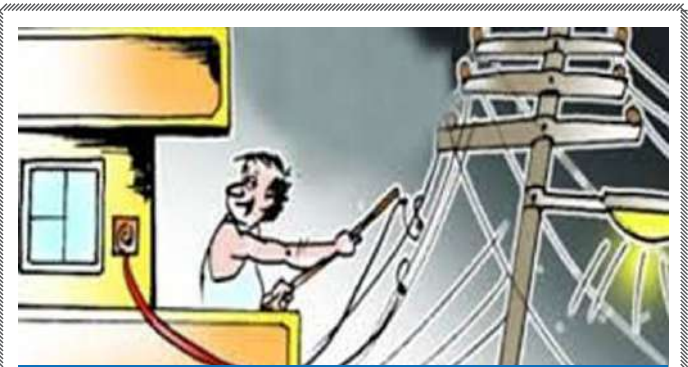
ભાવનગર ગ્રામ્ય ડિવિઝનમાં વીજ ચેકિંગ ડ્રાઈવ

આ આંકડાઓ શિક્ષણ મોડેલ પર ગંભીર સવાલો ઉભા કરે છે. શિક્ષણ વિભાગના એકરાર મુજબ, ગુજરાતમાં હજુ પણ અનેક શાળાઓ પાસે પોતાના મકાનો કે પૂરતા વર્ગખંડો નથી. માળખાગત સુવિધાઓના અભાવને કારણે રાજ્યની ૨,૬૭૪ શાળાઓમાં આજે પણ ‘પાળી પદ્ધતિ’ અમલી છે. પરિસ્થિતિ એવી છે કે, એક પાળીના વિદ્યાર્થીઓ છૂટે ત્યારે જ બીજી પાળીના બાળકોને અભ્યાસ કરવાની તક મળે છે. રાજ્યમાં હજુ પણ હજારો વર્ગખંડોની યત હોવાને કારણે વિદ્યાર્થીઓને શિક્ષણ મેળવવામાં પારાવાર મુશ્કેલીઓનો સામનો કરવો પડી રહ્યો છે. નવા વર્ગખંડો અને શાળાના મકાનોના નિર્માણમાં હજુ ઘણો સમય લાગે તેમ હોવાથી, વિદ્યાર્થીઓએ લાંબા સમય સુધી આ જ દયનીય સ્થિતિમાં અભ્યાસ કરવા મજબૂર બનવું પડશે તેવું ચિત્ર સ્પષ્ટ દેખાઈ રહ્યું છે.