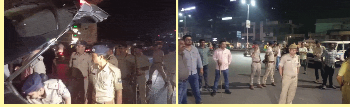
ઉત્તરવામાં આવી હતી.

અમદાવાદ શહેરમાં આગામી હોળી-ધુળેટી અને રમઝાન માસના તહેવારો દરમિયાન કાયદો અને વ્યવસ્થાની પરિસ્થિતિ જળવાઈ રહે તે હેતુથી પોલીસ દ્વારા ઝોન પ અને ઝોન ૬ વિસ્તારમાં સઘન પેટ્રોલિંગ હાથ ધરવામાં આવ્યું છે. સંવેદનશીલ વિસ્તારો અને મિશ્ર વસ્તી ધરાવતા વિસ્તારોમાં શાંતિ જળવાય તેમજ ગુનેગારોમાં કાયદાનો ડર પેસે તે માટે ૨ એસીપી અને ૮ પીઆઈ સહિત ૧૦૦થી વધુ પોલીસ કર્મીઓએ ફૂટ પેટ્રોલિંગ કર્યું હતું. હોળી અને ધુળેટીના તહેવારો દરમિયાન શાંતિ અને સલામતી જળવાઈ રહે તે હેતુથી ઝોન-૫ વિસ્તારમાં પોલીસ દ્વારા સઘન ફૂટ પેટ્રોલિંગ અને ફ્લેગ માર્ચ યોજવામાં આવી હતી. ખાસ કરીને સંવેદનશીલ ગણાતા હિન્દુ-મુસ્લિમ વસ્તી ધરાવતા મિશ્ર વિસ્તારોમાં કાયદો અને વ્યવસ્થાની સ્થિતિ જળવાવવા માટે ૨ એસીપી અને ૮ પીઆઈ સહિત ૧૦૦થી વધુ પોલીસ કર્મીઓ મેદાને ઉતર્યા હતા. આ પેટ્રોલિંગનો મુખ્ય ઉદ્દેશ્ય હિસ્ત્રીશીટરો અને રીઠા ગુનેગારોમાં કાયદાનો ડર પેદા કરવાનો છે. આ દરમિયાન રબારી કોલોની ચાર રસ્તા પાસે વાહન ચેકિંગ પણ હાથ ધરવામાં આવ્યું હતું, જેમાં નિયમ વિરૂદ્ધ કારના કાય પર લાગેલી બ્લેક ફિલ્મ સ્થળ પર જ