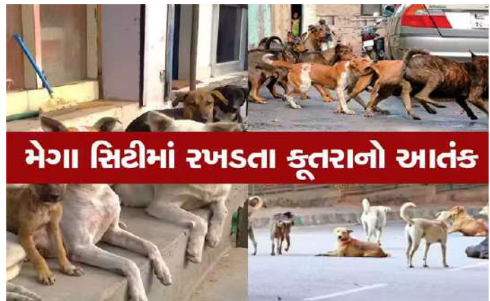
મેગા સિટીમાં રખડતા કૂતરાનો આતંક

શહેરના ભોરતળાવ, વડવા, ઘોઘાજકાતનાકા, સુભાષનગર, કાળિયાબીડ, ભરતનગર સહિતના વિસ્તારમાં રખડતા શ્વાનોનો આતંક : લોકો ત્રાહિમામ