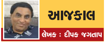
આજકાલ લેખક : દીપક જગતાપ