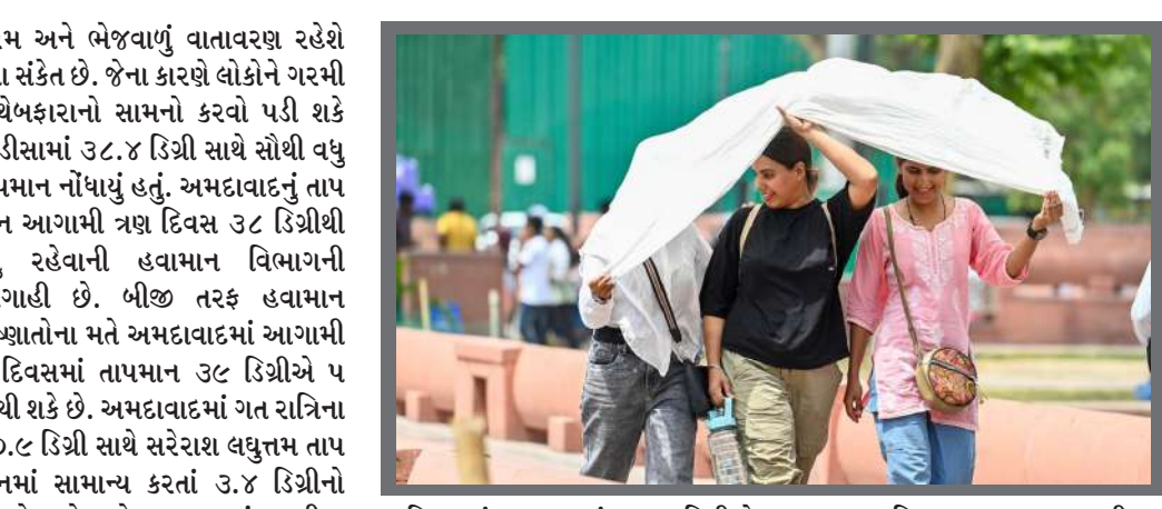
૨ દિવસમાં તાપમાનમાં હજુ ૩ ડિગ્રીનો વધારો થઈ શકે છે અને જેના પગલે હવામાન વિભાગ દ્વારા આગામી ૩ દિવસ માટે યલો એલર્ટ જાહેર કરવામાં આવ્યું છે. હવે તબક્કાવાર રાત્રિના તાપમાનમાં પણ વધારો થઈ શકે છે. ૮ શહેરમાં સરેરાશ મહત્તમ તાપમાનનો પારો ૩૭ ડિગ્રીથી વધારે નોંધાયો હતો. હવામાન વિભાગે ખાસ કરીને દરિયાકાંઠાના વિસ્તારો માટે એલર્ટ જાહેર કર્યું છે. ૪ માર્ચ થી ૬ માર્ચ દરમિયાન ગુજરાત અને સૌરાષ્ટ્ર-કચ્છના દરિયાકાંઠાના છૂટાછવાયા વિસ્તારોમાં ગરમ અને ભેજવાળું વાતાવરણ રહેશે તેવા સંકેત છે. જેના કારણે લોકોને ગરમી સાથે બફારાનો સામનો કરવો પડી શકે છે. ડીસામાં ૩૮.૪ ડિગ્રી સાથે સૌથી વધુ તાપમાન નોંધાયું હતું. અમદાવાદનું તાપમાન આગામી ત્રણ દિવસ ૩૮ ડિગ્રીથી વધુ રહેવાની હવામાન વિભાગની આગાહી છે. બીજી તરફ હવામાન નિષ્ણાતોના મતે અમદાવાદમાં આગામી ૩ દિવસમાં તાપમાન ૩૮ ડિગ્રીએ પહોંચી શકે છે. અમદાવાદમાં ગત રાત્રિના ૨૦.૮ ડિગ્રી સાથે સરેરાશ લઘુત્તમ તાપમાનમાં સામાન્ય કરતાં ૩.૪ ડિગ્રીનો વધારો થયો હતો. ગુજરાતમાં ગરમીના પ્રમાણમાં વધારો થઈ રહ્યો છે. આગામી

વધુ રહેવાની હવામાન વિભાગની આગાહી છે. બીજી તરફ હવામાન નિષ્ણાતોના મતે અમદાવાદમાં આગામી ૩ દિવસમાં તાપમાન ૩૮ ડિગ્રીએ પહોંચી શકે છે. અમદાવાદમાં ગત રાત્રિના ૨૦.૮ ડિગ્રી સાથે સરેરાશ લઘુત્તમ તાપમાનમાં સામાન્ય કરતાં ૩.૪ ડિગ્રીનો વધારો થયો હતો. ગુજરાતમાં ગરમીના પ્રમાણમાં વધારો થઈ રહ્યો છે. આગામી ૩ દિવસમાં તાપમાનમાં હજુ ૩ ડિગ્રીનો વધારો થઈ શકે છે અને જેના પગલે હવામાન વિભાગ દ્વારા આગામી ૩ દિવસ માટે યલો એલર્ટ જાહેર કરવામાં આવ્યું છે. હવે તબક્કાવાર રાત્રિના તાપમાનમાં પણ વધારો થઈ શકે છે.