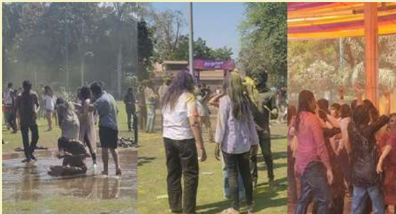
માણ્યો હતો. અનેક સ્થળોએ યુવાનો 'મડ હોળી' (કાઠવની હોળી) અને વોટર બલ્-સ્ટ્રી રમતા જોવા મળ્યા હતા, તો ક્યાંક ડીજેના તાલે રેઈન ડાન્સની જમાવટ જોવા મળી હતી. અમદાવાદની જાણીતી ક્લબમાં આ વર્ષે ધુળેટીનો નજારો કંઈક અલગ જ હતો. અહીં ભારતીય યુવક-યુવતીઓની સાથે વિદેશી પ્રવાસીઓ પણ રંગોત્સવમાં જોડાયા હતા. યુવાનોમાં ભારે જોશ જોવા મળ્યો હતો અને લોકોએ વિદેશી મહેમાનો સાથે સેલ્ફી પડાવી આ ક્ષણને યાદગાર બનાવી હતી. ડીજેના સંગીત પર લોકો મન મૂકીને ઝૂમ્યા હતા. ખાસ કરીને પ્રાઈવેટ પૂલ, ઓર્ગેનિક ક્લબ, વોટર ડ્રમ્સ અને ક્લબ શોર્ટ્સ જેવી

। પ્રતિનિધિ, અમદાવાદ, તા.૪ । ગુજરાત સહિત સમગ્ર દેશમાં ધુળેટીના પર્વની ધામધૂમથી ઉજવણી કરવામાં આવી રહી છે. અમદાવાદમાં ક્લબ, પાર્ટી પ્લોટ અને સોસાયટીઓમાં લોકોએ ડીજેના તાલે ઝૂમીને એકબીજાને ગુલાલથી રંગ્યા હતા. વહેલી સવારથી જ અબાલ-વુદ્ધ સૌ કોઈ વિવિધ રંગોમાં રંગાયેલા જોવા મળ્યા હતા. ઉત્સાહ અને ઉર્મંગના આ પર્વમાં લોકોએ હર્ષોલ્લાસ સાથે ખુશીઓ વહેંચતા સમગ્ર વાતાવરણ રંગીન બની ગયું હતું. બીજી તરફ, અમદાવાદના એસ.જી. હાઈવે પર આવેલી વિવિધ ક્લબમાં ધુળેટીની ભવ્ય ઉજવણી કરવામાં આવી હતી. અહીં લોકોએ હવામાં અખીલ-ગુલાલ ઉડાવી મિત્રો અને પરિવારજનો સાથે પર્વનો આનંદ