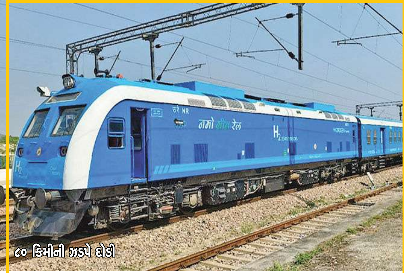
૮૦ કિમીની ઝડપે ઢોડી

પૂરવઠા બંધ થયા બાદ પ્રવર્તી રહી છે. કતારે સોમવારે લિક્વિફાઈડ નેચરલ ગેસ (એલએનજી)નું ઉત્પાદન અટકાવી દીધું હતું. અખાતી દેશો પર ઈરાનના સતત હુમલાને ધ્યાનમાં રાખી કતારે ગેસ ઉત્પાદન અટકાવી દેવાનો નિર્ણય આવી પડ્યો હતો એમ સ્થાનિક સુત્રોએ જણાવ્યું હતું. ગેસ ઉપરાંત કુદ તેલની ટેન્કરો પણ અટકી પડી છે. હોમ્બુર્ગ સમુદ્રમાર્ગને ઈરાને બંધ કરી દેતા પૂરવઠા પર અસર પડી છે. ભારત એલએનજીનો ચોથો મોટો ખરીદદાર દેશ છે અને એલએનજીની વધુ પડતી આયાત તે પશ્ચિમ એશિયા વિસ્તારમાંથી કરે છે. કતાર ભારતનો સૌથી મોટો પૂરવઠેદાર દેશ છે. ગયા વર્ષે દેશની એકંદર એલએનજી આયાતમાં ૪૦ ટકા હિસ્સો કતારનો રહ્યો હતો. વિશ્વમાં કતાર એલએનજીનું બીજુ મોટું નિકાસકાર દેશ છે.