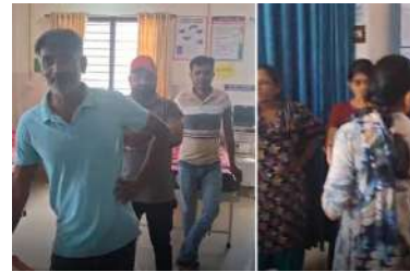
ડરનો માહોલ ઊભો થયો હતો. તે ડર દૂર કરવા અને કોઈ શંકામાં આવે નહીં તે માટે ૨૦ લોકોએ હડકવા વિરોધી રસી લીધી છે. તેમણે અન્ય કોઈ બીજી સારવારની જરૂર નથી એટલે તેમને ઘરે મોકલી દેવામાં