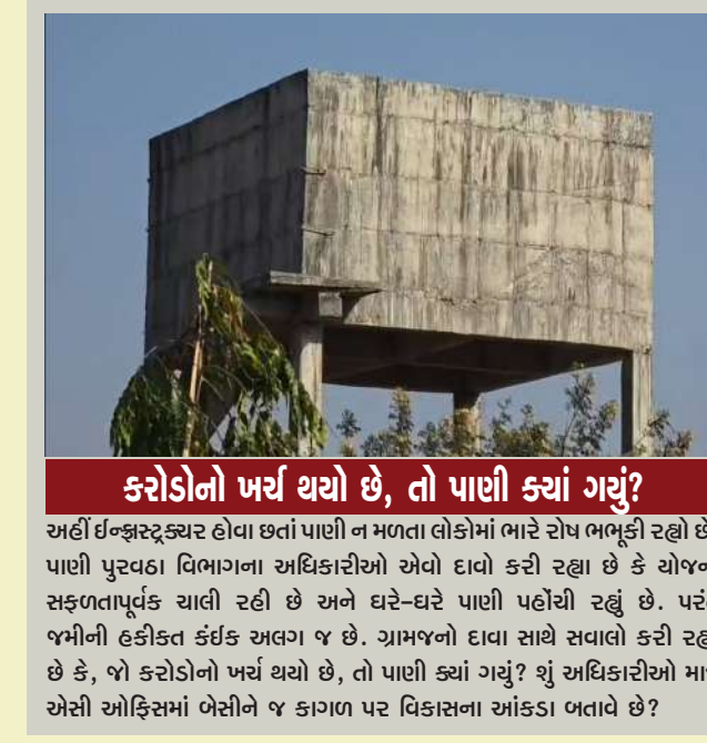
કરોડોનો ખર્ચ થયો છે, તો પાણી ક્યાં ગયું? અહીં ઈન્ફ્રાસ્ટ્રક્ચર હોવા છતાં પાણી ન મળતા લોકોમાં ભારે રોષ ભભૂકી રહ્યો છે. પાણી પુરવઠા વિભાગના અધિકારીઓ એવો દાવો કરી રહ્યા છે કે યોજના સફળતાપૂર્વક ચાલી રહી છે અને ઘર-ઘરે પાણી પહોંચી રહ્યું છે. પરંતુ જમીની હકીકત કંઈક અલગ જ છે. ગ્રામજનો દાવા સાથે સવાલો કરી રહ્યા છે કે, જો કરોડોનો ખર્ચ થયો છે, તો પાણી ક્યાં ગયું? શું અધિકારીઓ માત્ર એસી ઓફિસમાં બેસીને જ કાગળ પર વિકાસના આંકડા બતાવે છે?

ઉધારી દેવામાં આવ્યો છે, છતાં જનતા પાણી માટે વલખાં મારી રહી છે. આ ભ્રષ્ટાચાર છે કે તંત્રની નિષ્કાળજી? છેવાડાના આદિવાસી સમાજની આ મૂળભૂત જરૂરિયાત પ્રત્યે તંત્ર ક્યારે જાગશે તે મોટો પ્રશ્ન છે. હાલ તો ગ્રામજનો એક જ માંગ કરી રહ્યા છે કે વહેલી તકે કુપ્પા યોજનાનું પાણી જે કાગળમાં દેખાય છે તે વાસ્તવમાં તેમના નળ સુધી પહોંચાડવામાં આવે. છોટાઉદેપુરમાં એક તરફ સરકાર છેવાડાના માનવી સુધી શુદ્ધ પીવાનું પાણી પહોંચાડવાના દાવા કરી રહી છે, ત્યારે બીજી તરફ નસવાડી તાલુકાના કુકરદા ગામે 'વિકાસની ગુલબાગો'ની પોલ ખોલી નાખી છે. કરોડો રૂપિયાના ખર્ચે બનેલી કુપ્પા પાણી પુરવઠા યોજના માત્ર સરકારી ચોપડે જ સફળ દેખાઈ રહી છે, જ્યારે વાસ્તવિકતામાં દીવા તળે અંધારું જેવો ઘાટ ઘડાયો છે. કુપ્પા પાણી પુરવઠા યોજના ભ્રષ્ટાચાર થયો હોવાનો પણ દાવો થઈ રહ્યો છે. સરકારે કુપ્પા પાણી પુરવઠા યોજના અંતર્ગત ૮૨ કરોડ રૂપિયા જેવી માતબર રકમ ફાળવી હતી.